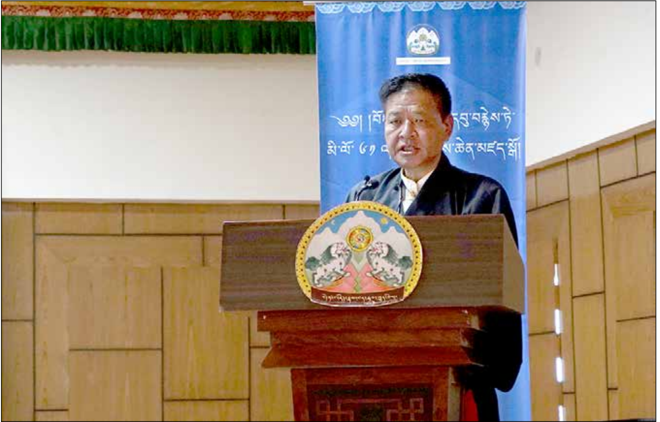
བོད་མིའི་མང་གཙོའི་དུས་ཚིག་ཐེངས་ ༦། སྤང་བཅི་གཟབ་རྒྱས་ཞུས་པ།