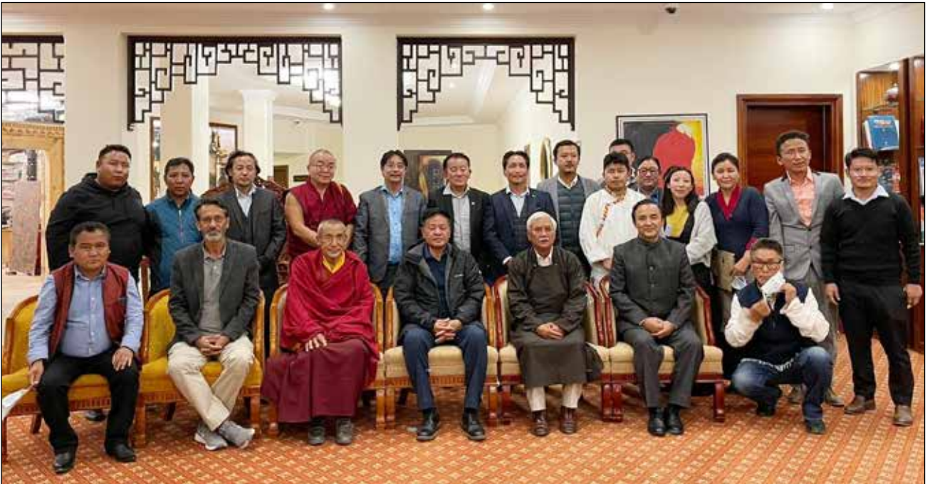
དཔལ་ལྷན་སྲིད་ཀྱི་སྲིད་པ་ཚོ་རིང་མཚོག་གིས་ལ་དྲགས་ཁུལ་དུ་འཚོམས་གཟིགས་ལེགས་པར་གྲུབ་པ།