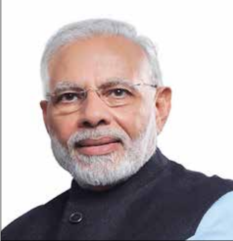
བུ་ཆགས་ཡོད། གོ་སྐྱེས་འདི་བརྒྱུད་དོས་ཀྱིས་རྒྱ་གར་ གཞུང་མང་གཉིས་ཀྱིས་གཏོང་མོད་ཆེན་པོའི་སྤྱི་ཚོམ་དུ་ཚོར་ གཉིས་སྤྱི་དང་གནང་བཞིན་པར་ཐུགས་རྒྱུ་ཆེ་ལུ་ རྒྱ་ལོ། ཐུགས་སྤྱི་དང་བཅས། ཞེས་འཁོད།

རྒྱུན་ཡོངས་འཕེལ་རྒྱས་སུ་འགྲོ་བར་ཞབས་འདེགས་སྤྱི་ ཀྱི་ཡོད། རྒྱ་གར་གྱི་གནའ་བོའི་རིག་གཞུང་འཚོ་བ་མེད་པའི་ལྷ་གྲུབ་ དང་། དེའི་རྒྱུ་བརྒྱུ་ལུ་མཐུད་འཕྲིན་ལྷན་སྤྱི་དང་རྒྱ་གར་ ནི་དང་སང་འཚོམ་སྤྱི་དང་འདྲི་སྤྱི་སྤྱི་ལ་དགོས་མཁོ་ཡོད་པ་ ཅམ་མ་བཟད། དོས་དོས་ཅན་ཞིག་ཀྱི་དུང་ཆགས་ཡོད་པ་དོས་ ལ་ར་འཕྲོད་ལུང་། དོས་ཀྱིས་འགྲོ་བའི་ཁོ་ཕན་རྒྱ་ཆེ་སར་ དམིགས་ཉེ་རྒྱ་གར་གྱི་གནའ་བོའི་རིག་གཞུང་དེ་དག་དང་ དང་རབས་ལོས་ཡོན་ལམ་ལུ་གཉིས་བཟུང་འབྲེལ་བྱེད་ ཐུབ་པའི་ཡིད་ཆེས་བྱེད་ཀྱི་ཡོད། གོ་སྐྱེས་ནམ་བུ་ལ་དོས་ཀྱིས་རྒྱ་གར་གྱི་མང་གཅོད་ བརྒྱན་དང་། ཚོས་ལུ་གས་ནང་ལུ་མཐུན་སྤྱི་ལ། འཚོམ་ མཐུན་བཅས་ལ་མེས་སུ་ཡི་རང་ལྷོ་གི་ཡོད། བཅོན་སྤྱི་ བོད་མི་རྣམས་ལ་མཚོན་ན་རྒྱ་གར་ནི། ད་ཚོའི་ཆོས་ ཕྱོགས་ཀྱི་སྤྱི་སྐྱེས་བཅོལ་ལྷོ་ས་ཞིག་ཆགས་ཡོད་པ་ཅམ་མ་ བཟད། འདས་པའི་ལོ་དོ་ ༥༡ རིང་ཚོའི་ཁྱིམ་གཞིས་ལྷོ་