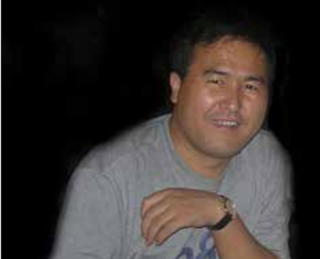
འཕྲུག་བུས་ཉེ་མི་སྤྱི་ལོ་འདས་པའི་མཉམ་གཅོད་ཚད་ མེད་བཏང་བའི་རྒྱུ་ལོས་ད་རྒྱ་ཁོང་ལ་སྤྱི་བཞི་བཅད་དང་། ལུས་པོ་སྤྱི་ལ། གཞུང་འཕྲུག་སོགས་ཀྱི་ནད་གཞི་སྤྱི་ལོ་