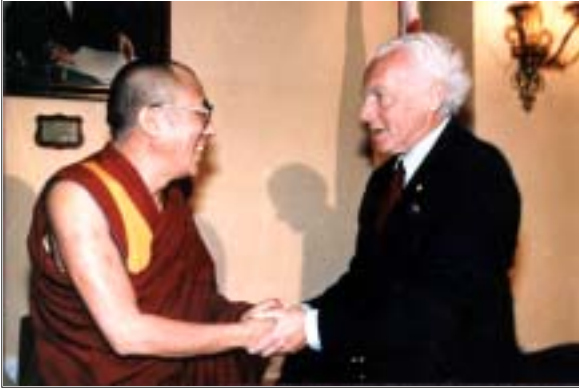
ཡཱ་ཁོང་ས་མཚོག་དང་སྐུ་ལྷབས་ཤོམ་ཡན་ཏེ་མི་རྒྱུ་གཉིས་ལྷན་བཞུགས།

ཁག་གཅིག་ལ་མཇལ་ཁ་དང་། ལུལ་དེར་ཡོད་པའི་རང་རིགས་མི་མང་ཉིས་བརྒྱ་ ཇུ་བརྒྱ་ལྷག་ཙམ་དང་སོག་རིགས་མི་མང་བཅས་ལ་མཇལ་ཁ་བཀའ་སློབ་། གསར་ ཤོག་དང་དུས་དེབ་གྲགས་ཙམ་ཁག་གཅིག་གི་ཚོམ་སྒྲིག་པར་བཀའ་སློབ་གསུང་ བཤད་བཅས་སྟེ།