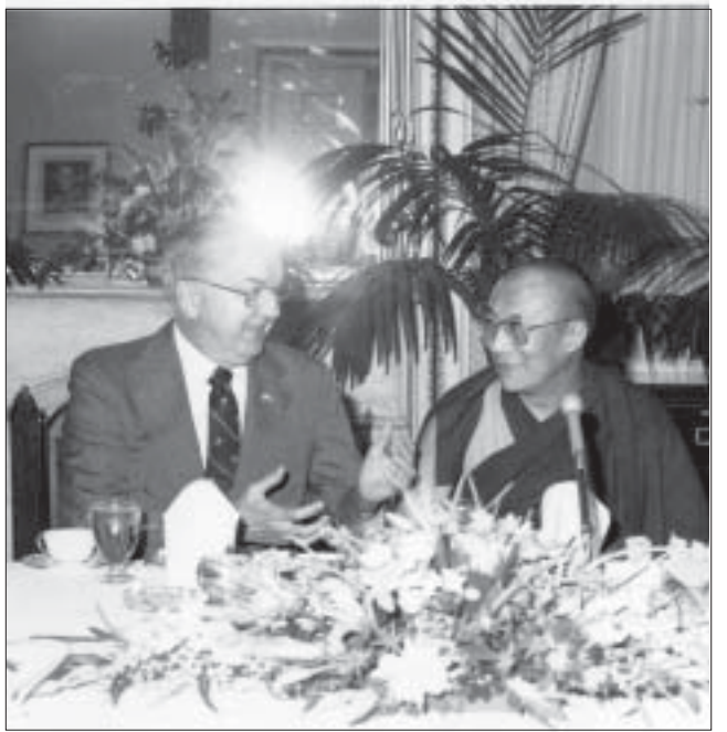
ཡགོང་ས་མཆོག་དང་སྤྱི་འབྲེལ་ཇ་སི་དམ་སི་རྒྱལ་གཉེས་ལྷན་བཞག་སྤྱི་ལེན་