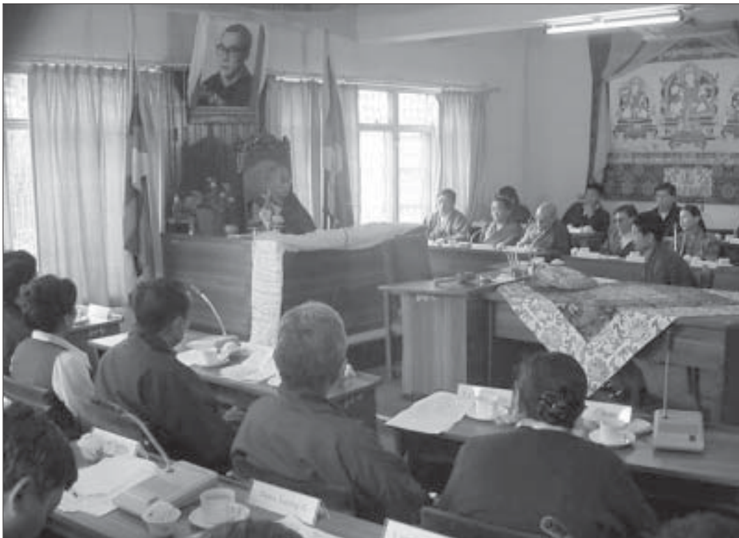
ཡལོང་ས་ཡ་སྐབས་མགོན་ཆེན་པོ་མཚོག་ནས་སྐབས་བཅུ་གསུམ་པའི་བོད་མི་མང་སྤྱི་འཐུས་ཁྲིའི་ཚོགས་དང་པོའི་ ཐོག་བཀའ་སློབ་སློབ་བཞིན་པ།