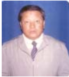
༡༠ ལྷ་རྩེ་ལྷ་མོ་རྩེ་འཛིན་པ། འོས་ཤོག་གཏང་ས། ༢༡༧