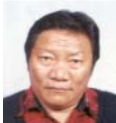
༩ ཨོ་དགའ། འོས་ཤོག་གྲངས། ༣༤༧༥