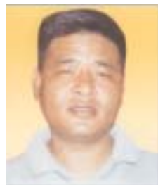
༧ རྗེ་ལ་ཚེ་རིང་། འོས་ཤོག་གྲངས། ༧༧༡