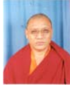
༡ ཚེ་རིང་ལུན་ཚོགས། འོས་ཤོག་གཏང་ས། ༡༡༠༤