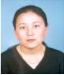
༤ འཇུ་ཚེན་དཀོན་མཚོ་ག འོས་ཤོག་གྲངས། ༤༧༧༠