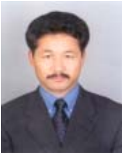
༡ ལུབ་བརྟན་ལུང་རིགས། འོས་ཤོག་གྲངས། ༡༣༧༧