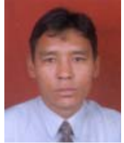
༤ ཟླ་བ་ཕུན་སྲིད། འོས་ཤོག་གཏངས། ༡༡༠༩