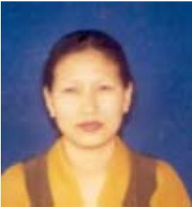
༡ ཚེ་རིང་ཚོར་འཛོམས། འོས་ཤོག་གཏངས། ༡༦༠༢༤