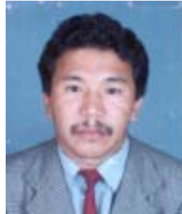
༧ ཨོ་ཚུན་བཟུན་འཛོམ། འོས་ཤོག་གཏངས། ༡༡༠༦