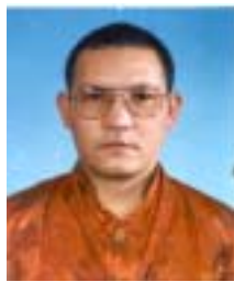
༡ འཇམ་དབྱངས་འཕྲིན་ལས། འོས་ཤོག་གཏང་ས། ༩༠༤