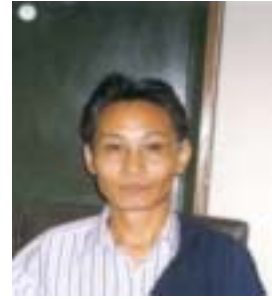
༨ རྒྱ་བཟང་ཤ་སེ་ཏེ། འོས་ཤོག་གཏངས། ༢༥༩༦