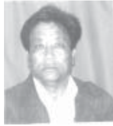
༡༠ དཀོན་མཚོ་གཙོ་བོ་བྲ། འོས་ཤོག་གྲངས། ༣༤༧༤