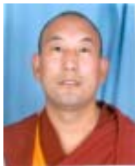
རྩེ་མོ་ལྷོ་བཟང་རྩེ་ལྷ་སྐྱུགས།