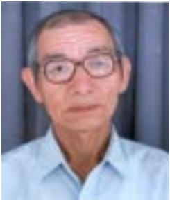
༧ དགེ་འདུན་རློན་པ། འོས་ཤོག་གཏང་ས། ༢༢༤