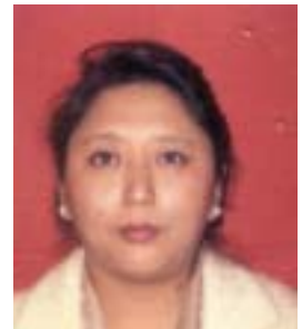
༣ རྒྱ་རི་རྒྱལ་མ། འོས་ཤོག་གཏངས། ༥༠༦༢