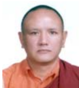
༢ རྒྱལ་སྐུ་ཨོ་ཚུན་སྟོབས་རྒྱལ། འོས་ཤོག་གཏངས། ༥༡༩༥