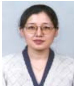
༦ འཕེལ་རྒྱས་རྗེ་ལ་མ། འོས་ཤོག་གྲངས། ༤༥༤