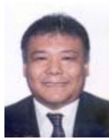
༡ བསོད་ནམས་ཚེ་རིང་ལ་ར་མི། འོས་ཤོག་གཏང་ས། ༩༠༩