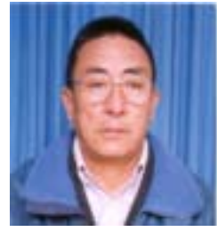
༧ འཚེ་མེད་དོ་རྗེ། འོས་ཤོག་གྲངས། ༤༩༡༠