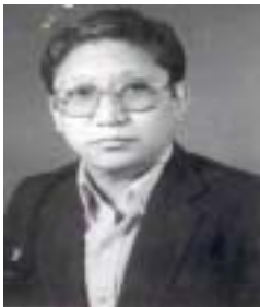
༡ ལུ་དྲུང་བསོད་ནམས་བཟང་པོ། འོས་ཤོག་གཏང་ས། ༡༤༤