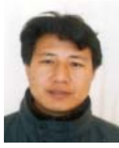
༣ རྟོ་གཙོ་འཛིན་མེད། འོས་ཤོག་གྲངས། ༡༠༥༤