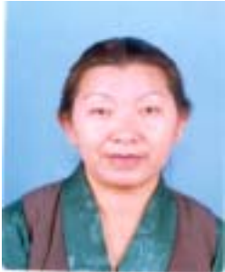
༥ རྒྱལ་མ་ཚེ་རིང་། འོས་ཤོག་གཏངས། ༡༡༠༡