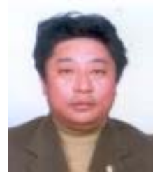
༡ ལྷ་རྩེ་ལྷ་སྐྱུག འོས་ཤོག་གཏང་ས། ༧༤༥