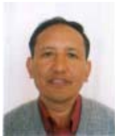
༡ ལྷན་པ་ཐོགས་མེད། འོས་ཤོག་གཏང་ས། ༧༥