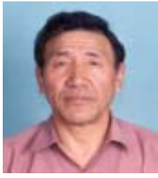
༥ ཚུལ་ཁྲིམས་བརྟན་འཛིན། འོས་ཤོག་གྲངས། ༤༧༧༥