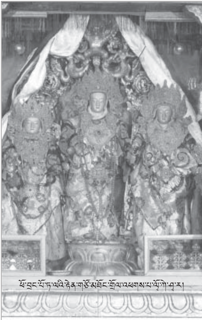
མོ་བྲང་པོ་ཏ་ལའི་རྟེན་གཙོ་མཐོང་གྲོལ་འཕགས་པ་ལོ་ལོ་གུ་ལྷ་ར།