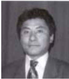
༡ བསྟན་འཕུང་གནས། འོས་ཤོག་གཏང་ས། ༩༤༤