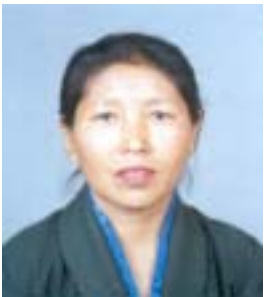
༩ ཚེ་རིང་རྒྱལ་མ། འོས་ཤོག་གཏངས། ༢༩༤༤