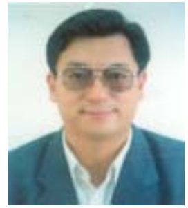
༤ གདུགས་དཀར་ཚེ་རིང་། འོས་ ཤོག་གྲངས། ༡༠༡༧