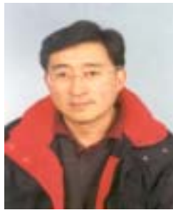
༢ བརྟན་འཛིན་མཁས་གྲུབ། འོས་ཤོག་གྲངས། ༡༠༧༤