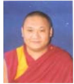
༡ ལུག་པ་བསྟན་འཕེལ་རྒྱ་ས། འོས་ཤོག་གཏང་ས། ༡༣༧༧