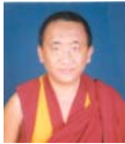
༡ བསྟན་འཛིན་ཤེས་རབ། འོས་ཤོག་གཏང་ས། ༡༤༩༡