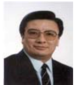
༡ གསལ་གྱིང་ཚེ་རིང་རྟོ་རྟེ། འོས་ཤོག་གཏང་ས། ༣༧༤