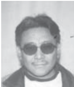
༦ ཀམ་ཚེས་འཕེལ། འོས་ཤོག་གཏངས། ༡༢༧༩