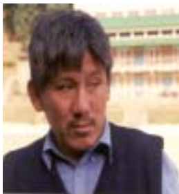
ལྷ་མོ་ཚེ་རིང་།