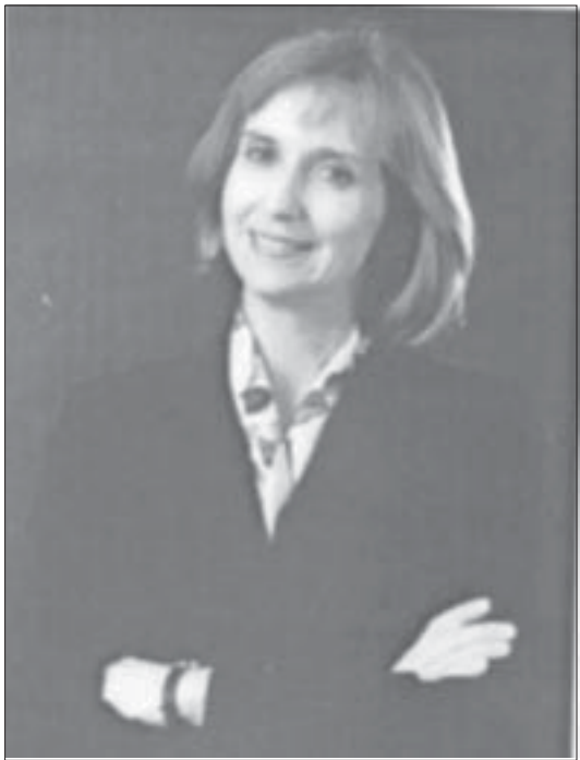
ལྷན་སྐུ་སྲིད་པ་འཛིན་པ་ལོ་ལོ་ལོ་ལོ་མཚོ་གནས་

སྲིད་འཛིན་སྐུ་བུ་འཛིན་སྐྱོང་ལྷན་ཁང་དང་། ཕྱི་སྲིད་དྲུང་ཆེ་སྐུ་ཚབ་པ་ཁོ་ལོ་ལོ་ལོ་ལོ་ མཚོ་གནས་ཕྱི་སྲིད་ལས་ཁུངས་ནང་རྒྱལ་ སྲིད་ལས་དོན་འགན་འཁུར་གྱི་དྲུང་ཆེ་ཕྱག་ རོགས་ལྷན་སྐུ་སྲིད་པ་འཛིན་པ་ལོ་ལོ་ལོ་ལོ་ དོན་འབྲེལ་མཐུད་ཀྱི་དམིགས་བསལ་སྐྱེ་ ཚབ་དྲུང་བསྐོ་གཞག་གནང་བ་ལྟར་ཁོང་གསལ་ དེ་ཡོད་ལས་འགན་ཐོག་བོད་དོན་དམིགས་ བསལ་འབྲེལ་མཐུད་ཀྱི་གཙོ་འགན་བཞེས་ རྒྱུ་དང་། ཁོང་གིས་གཙོ་བོ་བོད་དོན་དཀའ་ ཚོགས་གང་སྐྱར་གཙང་མེལ་ཡོངས་ཐབས་ སུ་རྒྱ་ནག་གཞུང་སྲིད་གཞུང་དང་། ལྷོ་ཁོང་ ས་ཏུ་ལོ་ལོ་ལོ་ལོ་མཚོ་གནས་ཁོང་གི་སྐྱེ་ཚབ་ བར་གྱིས་མོལ་འགོ་འདྲུགས་ཡོང་ཐབས་ གནང་རྒྱ། དེ་བཞིན་དེད་སྐབས་བོད་ཀྱི་ གནས་ཚུལ་ཐོག་ལས་དོན་གནང་མཁན་ སྲིད་གཞུང་ཁག་དང་། གྲིས་ཚོགས། གཞུང་འབྲེལ་མ་ཡིན་པའི་ཚོགས་པ་མང་ པོ་ཞིག་ཡོད་པ་བཅས་དེ་དག་དང་ཕན་ཚུན་འབྲེལ་ཟབ་གོང་མཐོར་བཏང་སྟེ་མཉམ་ ལས་གནང་རྒྱ་དེ་རེད། ཨ་རིའི་སྲིད་གཞུང་གསལ་བོད་ཀྱི་འགྲོ་བམིའི་ཐོབ་ཐང་གི་ གནད་དོན་དང་། བོད་མི་རིགས་ཀྱི་ཐུན་མོང་མ་ཡིན་པའི་ཚོས་དང་རིག་གཞུང་། རྒྱ་དམིགས་མི་རིགས་ཀྱི་དོ་བོད་པོ་མིས་སྲོལ་བཟང་པོ་རྣམས་གཅེས་འཛིན་ བྱ་རྒྱུར་རྒྱ་དམིགས་འཁུར་དང་རྒྱ་བསྐྱར་གྱི་བཞེད་ཡོད་པར་བརྟེན་དམིགས་ བསལ་འབྲེལ་མཐུད་པས་ལས་དོན་དེ་དག་ཐོག་སྐུ་བུ་སྲིད་ཀྱི་སྐྱེ་ཚབ་རྒྱ་ལྷན་ ཞིང་། གནད་དོན་དེ་ཚོ་ཞི་ཨ་རིའི་སྲིད་གཞུང་གིས་རྒྱ་ནག་གི་འགྲོ་བམིའི་ཐོབ་ ཐང་གནས་སྐངས་ཡང་རྒྱས་གཏོང་ཐབས་གྱི་དེ་ཡོད་པའི་གཞི་ཚུལ་སྲིད་བྱས་དང་ཡོངས་ སུ་མཐུན་པ་ཞིག་ཡིན་ཞེས་གསུངས་པ་རེད།