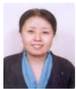
༨ ཚེ་རིང་མཚོ་མོ། འོས་ཤོག་གྲངས། ༧༤༠