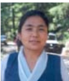
༥ རྗེ་ལ་དཀར་རྩ་མོ། འོས་ཤོག་གྲངས། ༧༡༥