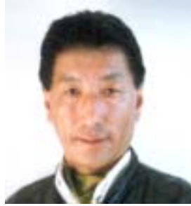
༣ ངག་དབང་བཟུན་པ། འོས་ཤོག་གཏངས། ༡༡༩༦