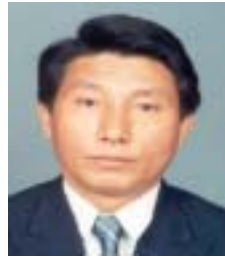
༦ ཚེ་རིང་དོ་རྗེ། འོས་ཤོག་གྲངས། ༤༩༡༡