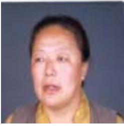
༨ བྱུང་བ་བུ་མོ་ཚེ་བརྟེན། འོས་ཤོག་གྲངས། ༤༠༩༤