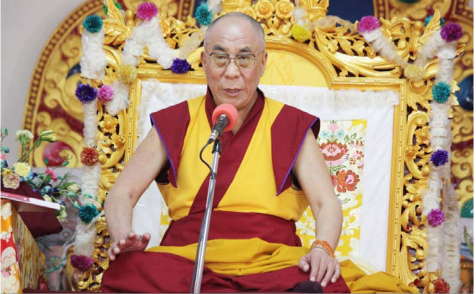
ཡགོང་ས་ཡུལ་མཚོགས་སྤྱི་འབྲུག་བུ་ཚུ་བཞི་པ་ཆེན་པོ་མཚོགས་མེས་སྤྱི་མི་མང་ལ་རྒྱང་དོར་གྱི་བཀའ་སློབ་བཀའ་དིན་སྐུལ་བཞིན་པ།

ཚོན་མཚོག་དང་། བོད་མི་མང་སྤྱི་འབྲུས་ཚོགས་ གཞིན་རྒྱ་རི་སློབ་མ་མཚོག་ དེ་བཞིན་སྤྱི་འབྲུས་ དང་། དགོན་སྡེ་ཁག་གི་སྐྱེལ་མཁན་པོ། དེ་