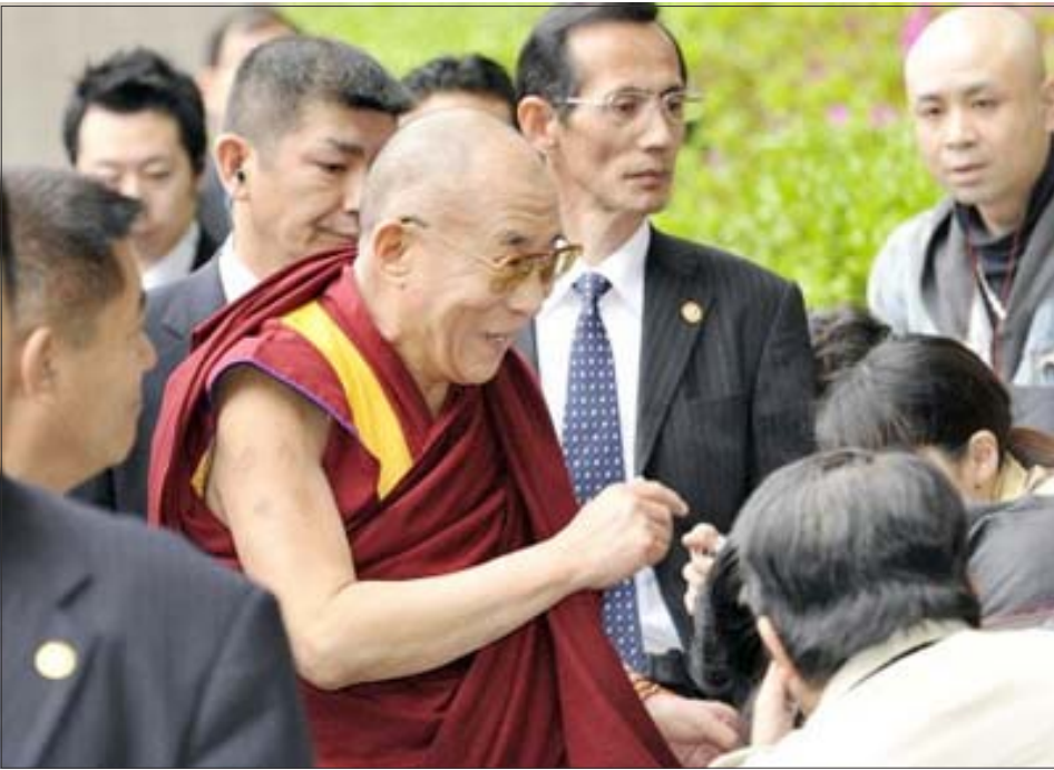
སྤྱི་ཚོར་ཡགོང་ས་ཡུལ་མགོན་ཆེན་པོ་མཚོག་ནས་གསལ་འགོད་པ་ཚོར་བཀའ་ལན་གནང་བཞིན་པ།