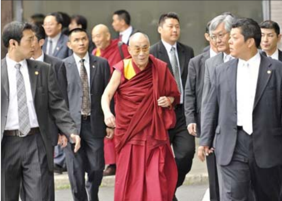
སྤྱི་ཚོར་ཡགོང་ས་ཡུལ་མགོན་ཆེན་པོ་མཚོག་ཉི་རྟོང་ན་རེ་དུ་རྒྱལ་སྤྱིའི་གནམ་ཐང་དུ་ཡུལ་སྐོར་འཁོད་བཞིན་པ།

ས་མཚོག་གིས་བཀའ་ཕྱེབས་དོན། སྤྱིར་བོད་མི་སྤྱི་བོ་ཡིན་ནའང་སྤྱི་གསལ་ནང་གསལ་ཡིན། རྒྱ་ནག་གཞུང་གི་ཞན་ཆ་གཅིག་ནི་སྤྱི་གསལ་ནང་གསལ་