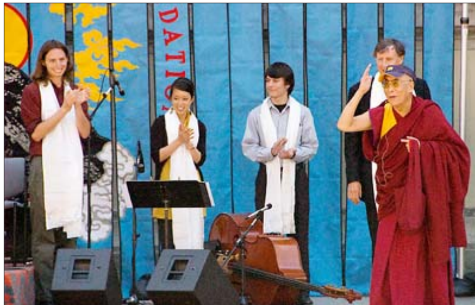
སྤྱི་ཚོར་ཡགོང་ས་ཡུལ་མགོན་ཆེན་པོ་མཆོག་ནས་བུམས་བཅེ་བརྒྱུད་ནས་ཞི་བདེ་ཞེས་པའི་བོད་གཞིའི་ཐོག་བཀའ་ སློབ་མ་སྦྲུལ་སྦྲུལ་དེ་གར་བཅས་མི་ཚམས་ལ་འཆོམས་འདྲི་གནང་བཞིན་པ།

གཉེན་ཁང་དེའི་སློབ་སྦྱོང་གཙོ་བོར་འགྱུར་བའི་ གཞིན་སྤྱི་ཚོར་ལོ་ལོ་ལོ་ལོ་ལོ་ལོ་ལོ་ལོ་ལོ་ རབས་ཉེར་གཅིག་པའི་མི་ཚམས་ཀྱིས་བུམས་བཅེ་