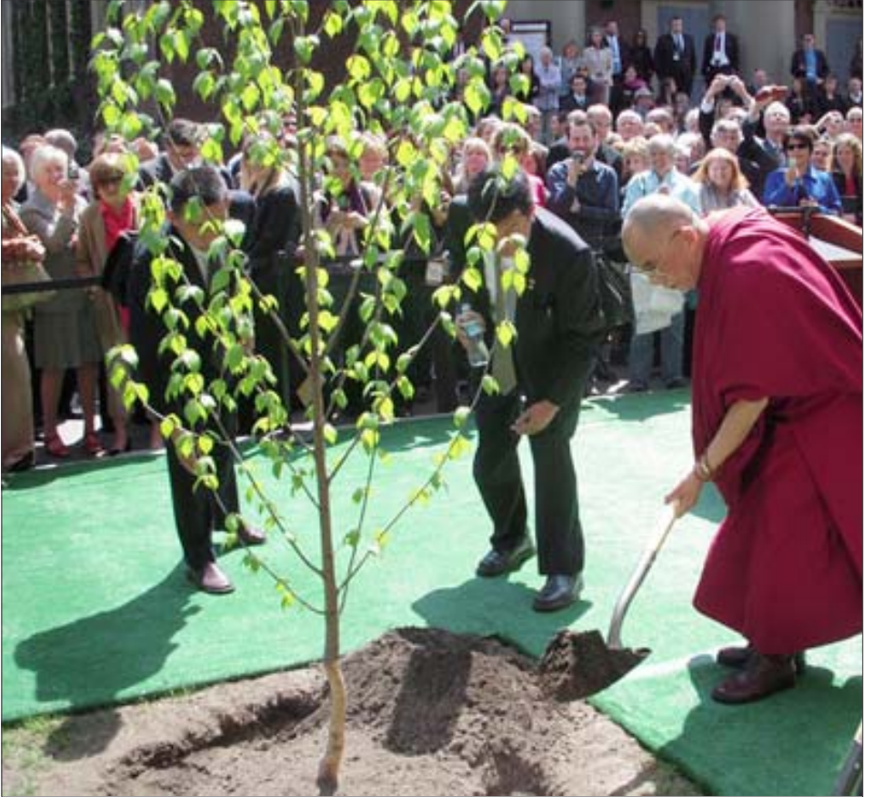
ཡལོང་ས་ཡ་སྐབས་མགོན་ཆེན་པོ་མཚོག་ནས་ཉར་ཤར་ཉེ་གཙུག་ལག་སློབ་གཉེར་ཁང་གི་དྲན་རྟེན་ལྷ་ཁང་གི་མདུན་དུ་ རྗོན་གིང་འདེབས་འཛུགས་གནང་བཞིན་པ།

བརྗོད་བསྐྱར་ལ་རྗེས་སུ་ཡེ་རང་དང་གུས་བཀའ་ལྷུ་ བཞིན་ཡོད། ཅས་སོགས་ཞུས་ཡོད། ཐོངས་འདིའི་མཛད་སྟོན་སྤྱི་ཚོར་ཡལོང་