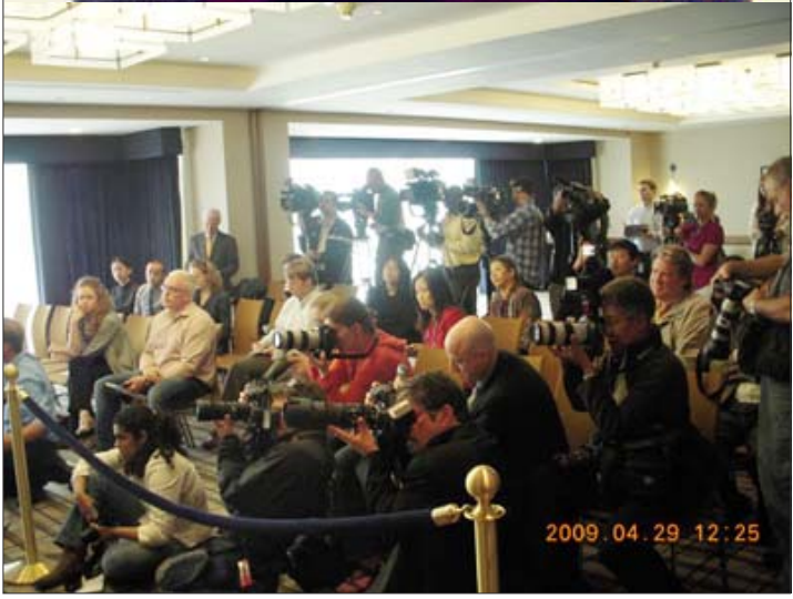
ཡུ་ལྷོ་ལྗོངས་མཚོག་ནས་གསར་འགོད་པའི་དྲི་བ་ཁག་ལ་བཀའ་ལན་གནང་བཞིན་པ།

མོ་པམ་དགོས་པ་ཞིག་ལ་དུས་ད་ལྟོ་འདྲི་ལུགས་ ཀྱི་མིང་ཐོག་ནས་སྟོན་འཛིང་མང་པོ་ཞིག་ཡོད་གི་ ཡོད་སྟབས་ཚོས་ལུགས་ཀྱི་མཐུན་ལམ་ནི་ད་ཅང་གི་ གལ་ཆེ་ཡིན། ཞེས་བཀའ་ལན་པོ་ཡོད།