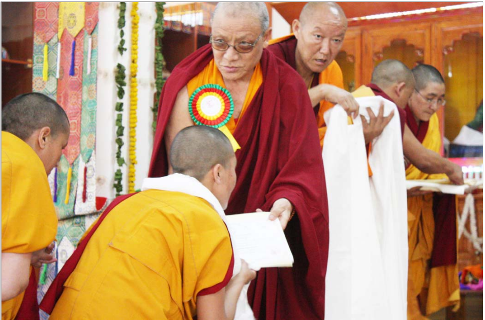
དཔལ་རྒྱན་ཚོས་རིག་བཀའ་སློབ་མཚོགས་དུ་ཕུར་རབ་འབྲུགས་པའི་འཛིན་རིམ་གསུམ་ལ་ཕྱག་འཁྲིལ་གནང་བ།

རྒྱགས་སྤོན་དུ་ཆེབས་ཞལ་བསྐྱུར་བ་དང་། རྒྱ་མཚོན་ ཁག་དང་མི་མང་། ས་གནས་རྒྱ་གར་ཡུལ་མི་བཅས་ ལ་ཡང་ཉིན་གྲུང་གི་གསོལ་ཆོགས་ཀྱང་གནང་ཡོད། ད་རེས་ཀྱི་བཙུན་དགོན་འཇམ་དབྱངས་ཚོས་ མེད་གཙུག་ལག་ཁང་གི་དབུ་འབྲེད་མཛུགས་ སྤོབས་པའི་རྒྱ་མཚོན་དུ་དཔལ་རྒྱན་ཚོས་རིག་བཀའ་