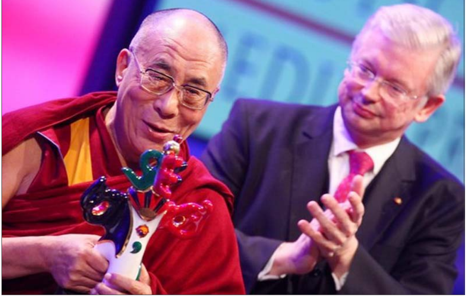
སྤྱི་ནོར་ཡུ་གོང་ས་ཡ་སྐབས་མགོན་ཆེན་པོ་མཚོག་ལ་ཇར་མན་གསར་འགོད་པའི་བྱ་དགའ་ཆེ་ཤོས་དེ་འབྲུལ་བཞེས་མཛད་བཞེས་པ། བཞེས་གཟེགས་འབྲུལ་ལུས་ཡོད། དེ་ནས་མི་ཏན་ བོས་དེ་འབྲུལ་བཞེས་གནང་ཡོད།

དེ་ཡང་སྤྱི་ནོར་ཡུ་གོང་ས་ཡ་སྐབས་མགོན་ཆེན་ པོ་མཚོག་ལྷ་ཏན་ལྷ་ཏན་གནས་ཐང་ནས་བཞུགས་ གནས་མགོན་ཁང་ལ་ཡུལ་སའི་འགོད་སྐབས་ཇར་ མན་ནང་གནས་སྡོད་བོད་མི་རྣམས་ཀྱིས་གཙོས་ཇར་ མན་མི་རིགས་དང་། ལྷོ་སི། ཉོར་སྤེ། ལྷོ་ལྷོ་པར་ དུ་མཛད་སྤོ་དྲོ་ཉེན་འབྲེལ་ལུ་སྤྲད་སྤྲད་སི་ནས་བོད་ རིགས་སྤོ་གར་བ་ཆེད་བཅར་ལུས་ཡོད་པ་རྣམས་ གྱིས་སྤྱི་ནོར་ཡུ་གོང་ས་ཡ་སྐབས་མགོན་ཆེན་པོ་ མཚོག་ལ་བཀྱིས་ཉེན་འབྲེལ་མཚོན་ཆེད་དུ་གྲོ་སི་སྤྱོད་ མར་འདེགས་འབྲུལ་ལ་མ་ཟད། བོད་གྱི་སྤྱོད་ མོང་མ་ཡིན་པའི་གནས་སྤོ་དྲོ་སྤྱོད་བཅས་ གྱིས་མེད་སེམས་བསུ་གཟབ་ཀྱིས་ལུས་ཡོད།