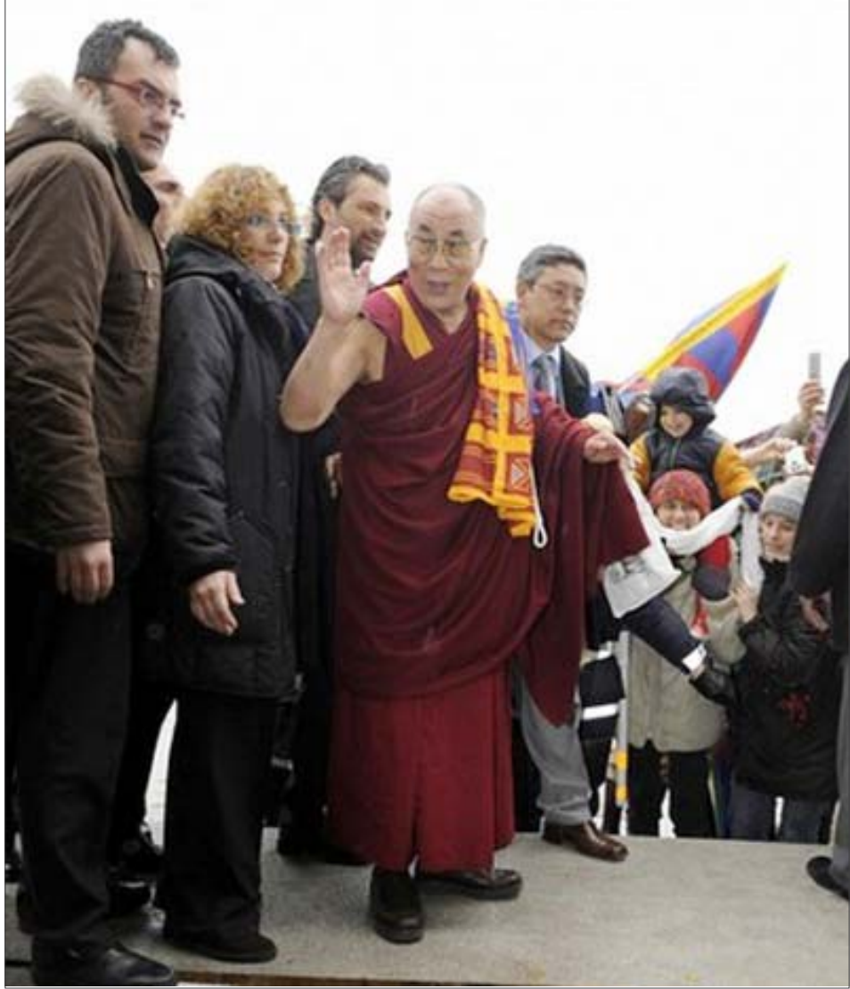
སྤྱི་ནོར་ལ་གོང་ས་ལྗེས་འདུག་མགོན་ཆེན་པོ་མཚོག་གོང་ཁྲིར་སྤེལ་མའི་ནས་ཐེབས་ཐོན་སྐབས།

དོན། བོད་མིའི་ལྗེས་འདུག་མགོན་ཏུ་ལོའི་སྐྱེས་མཚེས་ གིས་བོད་མིའི་རང་དབང་དང་། རང་ཐག་རང་གཅོད་ འཐབ་ཚེད་ཀྱི་སློབ་རིག་དེ་མཚམས་མི་ཆད་པར་ལུ་ མཐུད་རྒྱུན་འབྲོངས་གནང་བཞིན་ཡོད་པའི་སྐབས་ དེར་རང་ཚོས་གཤམ་ལྡན་མེད་པའི་རྒྱུ་རྐྱེན་མཚོན་ སྤྲད་ཆེ་བསྟོད་མི་མེར་གྱི་ཕྱག་འབྲེལ་དེ་འབྲུལ་ལམ་ ལུ་གི་ཡོད་ཅེས་གསུངས་ཡོད།