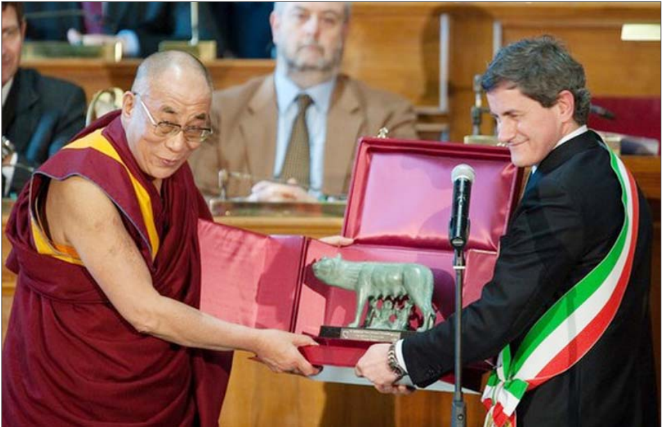
སྤྱི་ནོར་ཡ་གོང་ས་ཡ་སྐབས་མགོན་ཆེན་པོ་མཚོག་ལ་རོམ་གྲོང་ཁྲུང་གི་ལོ་རྒྱུས་ལྡན་པའི་སྤྱི་ཚོའི་གཟུགས་བརྙན་གྱི་ཆེ་བསྟོད་མི་ མེད་ཀྱི་ཕྱག་འཁྲུང་འབྲུལ་ལམ་ལུ་བཞིན་པ།

བསྐྱར་སྒོམ་གནང་ཡོད་པ་རེད། རྫོན་ལོ་སྤྱི་ཟླ་ ༩ རང་ནས་བཟུང་བོད་ནང་དུ་གཞན་གོན་གྱི་བྱ་སྤྱོད་སྟེལ་ བ་དེས་རྒྱ་ནག་གཞུང་ཕྱོགས་ལ་ཡོད་པའི་ཡིད་ཆེས་ དེ་རྒྱུད་དུ་སོང་ཡང་རྒྱ་ནག་ནང་གི་ཤེས་ཡོན་ཅན་