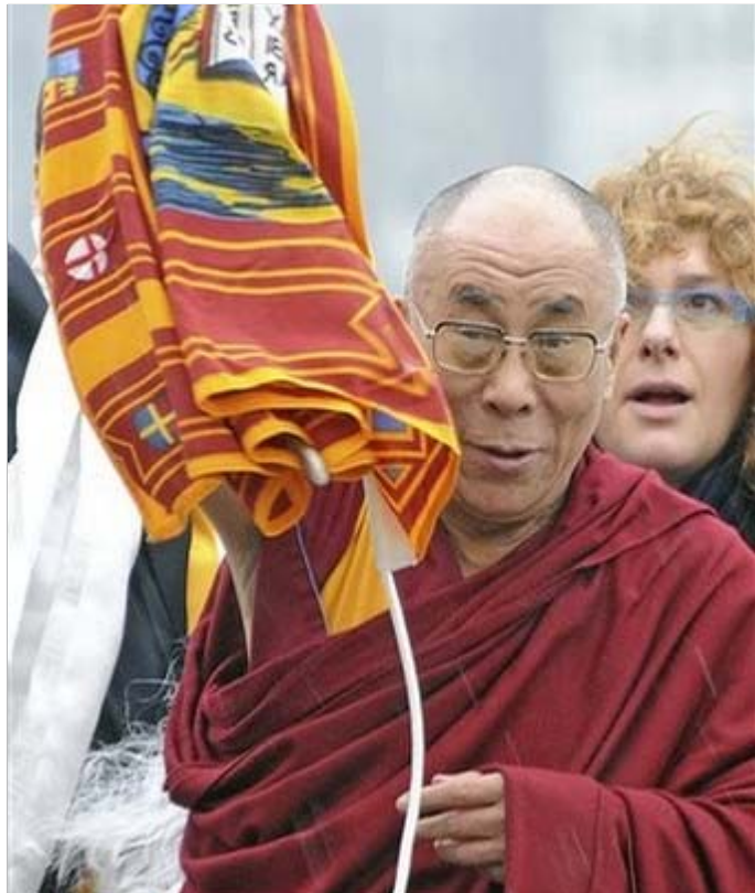
སྤྱི་ནོར་ཡལོང་ས་ཡ་སྐབས་མགོན་ཆེན་པོ་མཚོག་ལ་གོང་ཁུར་ཕྱི་ནི་སིར་ཆེ་བསྟོད་སྤྱི་འབྲུལ་གྱི་ མཚན་མཐོང་ཕྱག་འཁྲུང་འབྲུལ་བཞེས་ཀྱི་སྐབས།

༡༩༩༩ ལོའི་ ༡༠ ཉིན་ ཡལོང་ས་ཡ་སྐབས་མགོན་ ཆེན་པོ་མཚོག་དང་ཨི་ཏེ་ ལི་འི་གྲོས་ཚོགས་ཀྱི་བོད་ དོན་རྒྱུ་རྒྱུ་རྒྱུ་རྒྱུ་ ཚོགས་གཙོ་སྤྱི་ལྷུ་ལྷུ་ མི་ལ་མི་(Matteo Mecacci) དང་ལྷན་དུ་ཨི་ཏེ་ལི་འི་ ས་རོམ་ནས་སྤེའི་ཆེད་ གཏོང་གནས་སྤེའི་ཕྱི་ སིའི་གོང་ཁུར་དུ་གནང་ འདྲེན་ལྷུས་ཡོད་པ་ལྟར། གནས་ཐང་དུ་ཡལོང་ས་ འཁོར་སྐབས་ཕྱི་ནི་སིར་གོང་ ཁུར་གྱི་ཚོགས་གཙོ་སྤྱི་ ལྷུ་ལྷུ་ ལྷུ་ལྷུ་རེ་ན་པོ་བ་རོ་པོ་ མཚོག་ནས་ཕེབས་བསྐྱར་རྒྱུས་ལྷུས་ཡོད་པ་རེད། ཉིན་དེའི་སྤྱི་ནོར་ཡལོང་ས་ཡ་སྐབས་མགོན་ཆེན་པོ་ མཚོག་ནས་ཡལ་དེའི་བོད་དོན་རྒྱུ་རྒྱུ་རྒྱུ་རྒྱུ་ ཚོགས་གཙོ་ཉེ་ལྷུ་ཚོགས་པའི་ཚོགས་གཙོ་བཞེས་ པ་སྤྱི་ལྷུ་ལྷུ་ལྷུ་ལྷུ་ལྷུ་ལྷུ་ལྷུ་ལྷུ་ལྷུ་ ཡོད། དེ་རྗེས་བོད་དང་ཨི་ཏེ་ལི་འི་མངའ་འབྲུལ་ཚོགས་ པའི་ལས་བྱེད་རྒྱུ་རྒྱུ་རྒྱུ་རྒྱུ་རྒྱུ་རྒྱུ་ མི་སིའི་ས་གནས་གཞུང་གི་ལས་ཁུངས་སྤྱི་གནང་འདྲེན་ ལྷུས་པ་བཞིན་ཆེབས་སྤྱི་བསྐྱར་ཡོད། ཐེངས་ འདིར་གོང་ཁུར་ཕྱི་ནི་སིར་མི་མེར་གྱི་ཆེ་བསྟོད་ཕྱག་ འཁྲུང་འབྲུལ་ལམ་ལྷུ་རྒྱ་འདི་ནི་ལོ་གཅིག་གོང་ནས་ ཐག་གཅོད་བྱུང་བ་ཞིག་ཡིན་འདུག དེ་ཡང་ཉིན་དེར་གོང་ཁུར་ཕྱི་ནི་སིར་སྤོན་ གྲུགས་ཡོད་པའི་ཚོགས་ཁང་ཆེན་མོའི་ནང་དུ་ཕྱི་ནི་ སི་གོང་སྤེའི་སྤྱི་ལྷུ་ལྷུ་ལྷུ་ལྷུ་ལྷུ་ལྷུ་ལྷུ་ (Massimo Caccari) དབུས་པའི་ས་གནས་རྫོང་ དཔོན་དང་། གོང་ཁུར་དེའི་ས་གནས་འབྲུས་མི་བཅས་