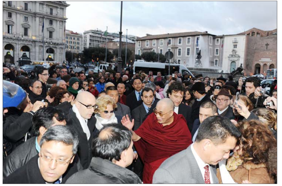
མི་མང་བརྒྱ་ཕྱག་མང་པོས་དགའ་ཚོར་ཆེན་པོས་སྤྱི་ཚོར་ཡོ་ཞོང་ས་ཡ་སྐྱབས་མགོན་ཆེན་པོ་མཆོག་ལ་ཕེབས་བསུ་ལྷུ་བཞིན་པ།

དོན་གཅོད་པོ་ཞི། ཨི་ཏ་ལིའི་རྒྱལ་ས་རོམ་གྲོང་སྡེ་ ལས་ཁུངས་དང་གྲོས་ཆོགས་ནས་སྤྱི་ཚོར་ཡོ་ཞོང་ས་ ཡ་སྐྱབས་མགོན་ཆེན་པོ་མཆོག་གིས་རྒྱལ་སྤྱིའི་ནང་ འགྲོ་བ་མིའི་ཐོབ་ཐང་གོང་སྐྱེལ་གཏོང་ཐབས་གནང་ བ་དང་རྒྱག་དོན་འཛེ་མེད་ཞི་བའི་ཐབས་ལམ་གྱི་ཐོག་ རྣམས་བོད་ཀྱི་གནད་དོན་སེལ་ཐབས་གནང་དང་གནང་