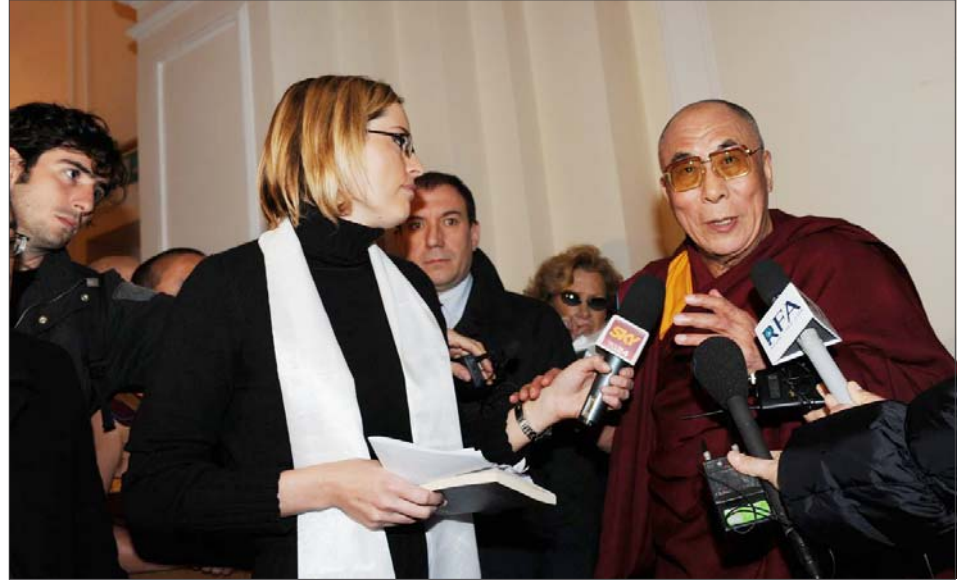
སྤྱི་ཚོར་ཡོ་ཞོང་ས་ཡ་སྐྱབས་མགོན་ཆེན་པོ་མཆོག་ནས་གསུང་འགོད་པར་བཀའ་སློབ་སྦྱོར་བཞིན་པ།

ལུས་ཡིན་པར་ཆེ་བརྗོད་ལྷུ་སྤྱད་སྤྱི་ལོའི་སྤྱི་ཟླ་ རང་ཡོ་ཞོང་ས་ཡ་སྐྱབས་མགོན་ཆེན་པོ་མཆོག་ལ་གོང་ ཁྲིར་དེའི་མི་སེར་གྱི་ཆེ་བརྗོད་ལྷུ་གི་འཁྲིར་འདུལ་