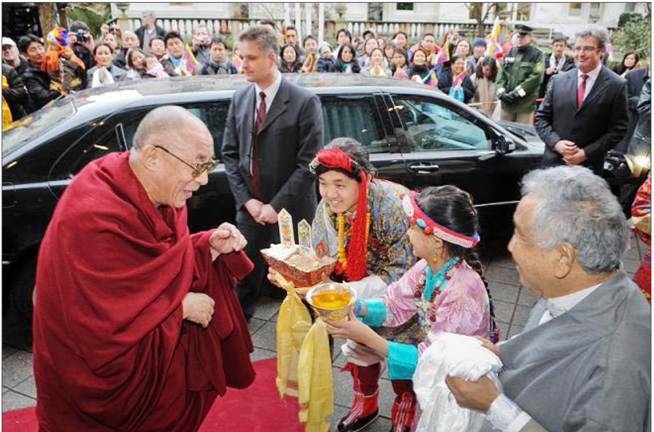
སྤྱི་ནོར་ཡུ་གོང་ས་ཡ་སྐབས་མགོན་ཆེན་པོ་མཚོག་ཇར་མན་གྱི་གོང་ཁྲིའི་ལྷ་ཏན་ལྷ་ཏན་ཡུ་གོང་སའི་འགོད་སྐབས་མེད་སེམས་བསུ་ གཟབ་ཀྱིས་ལུ་བཞེས་པ།

སྤོ་ལྷོ་ཆེན་ཆེན་གཞིས་ནས་གསུམ་བུ་ཆེན་པོས་ སྤྱི་ནོར་ཡུ་གོང་ས་ཡ་སྐབས་མགོན་ཆེན་པོ་མཚོག་ལ་ ཇར་མན་གསར་འགོད་པའི་ཆེ་བསྟོན་བྱ་དགའ་ཆེ་