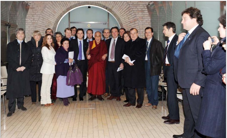
སྤྱི་ནོར་ཡ་གོང་ས་ཡ་སྐབས་མགོན་ཆེན་པོ་མཚོག་དང་ཨི་ཏུ་ལིའི་གྲོས་ཚོགས་ཀྱི་བོད་དོན་རྒྱུ་སྤྱོད་ཚོགས་པའི་འཐུས་མི་ རམས་མངལ་འཕྲད་མངོན་བཞིན་པ།

ཀྱི་རིན་ཐང་གོང་མཐོར་གཏོང་གནང་རྒྱུ་དང་། འཛམ་གླིང་ཚོས་ལུགས་སུ་ཚུན་མངོན་མཐུན་ མཉམ་གནས་ཡོང་བའས། བོད་མི་ཞིག་ཡིན་པའི་ ཆ་ནས་བོད་དོན་ཐོག་ལ་འགན་འཁུལ་ཡོད་པ་བཅས་