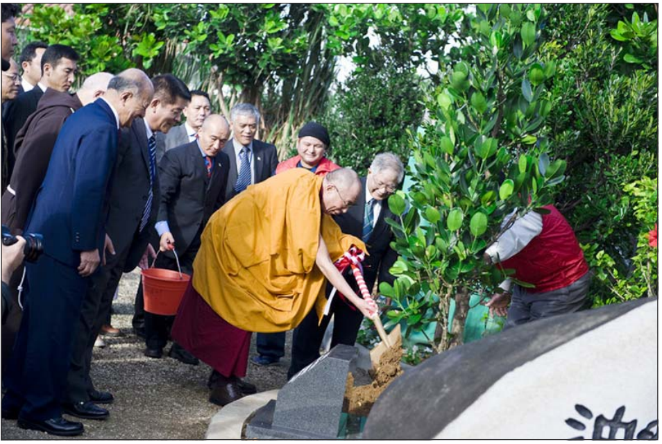
ཡགོང་ས་མཚོག་ནས་དམག་ཆེན་གཉིས་པའི་སྐབས་འདས་གོང་ས་སྤུ་གུར་བ་རྣམས་ཀྱི་ཆེད་དུ་བྲན་གསོལ་ཨོ་གི་ན་བའི་སྐུ་མ་རྩ་ཤིང་སྤྱི་ལོ་ལྟར་འདེབས་འཇུགས་མཛད་བཞིན་པ།

ནམས་སྤོང་སྤོང་ཕམ་ཅན་དེ་དག་ནས་བསྐྱུར་བྱ་ལེན་བྱུང། རྒྱ་དེ་ཉེ་ཉོང་ས་རང་ལྷ་ས་དང་རྒྱ་གར་ནང་པའི་ཐོག་དཀའ་ངལ་རྣམས་གོས་མོལ་གྱི་ལམ་ནས་སྤོང་སྐབས་དེ་རང་ཐོས་སྤོང་བ་བྲན་བྱུང། ང་ཚོ་