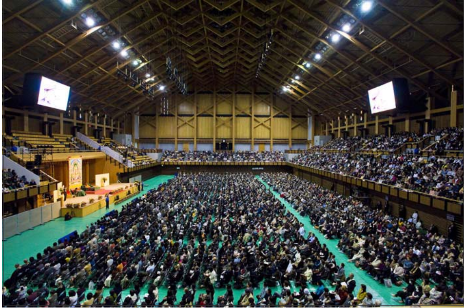
ཡགོང་ས་མཚོག་ནས་མང་ལམ་མཉེན་ཅང་ཆེན་མོར་མེ་ཚེ་བདེ་སྐྱིད་རྙོག་གྲ་བཟོ་བ་བྱེད་གོས་ཀྱི་རྒྱུ་ལ་བཀའ་སྣུལ་སྐྱབས།

ཐོག་ཇི་ལྟར་གསེལ་འདེབས་ལྲིས་པ་བཞིན་ཡགོང་གནས་ཡོད་པས། དའི་དོན་དག་དའི་བྱིས་ཚང་། ས་མཚོག་ཆེབས་སྐྱུར་བསྐྱེད་མ་ཉེ་བོག་མར་སྒྲོན་ད་ཚོའི་རྒྱལ་ཁབ་ཅེས་རང་དོན་གྱི་བསམ་བཤེས་ ལམ་གསོལ་འདེབས་མཛད་རྗེས། མི་ཚེ་བདེ་སྐྱིད་རྙོག་གྲ་བཟོ་གི་ཡོད་ཅེས་བཀའ་སྣུལ། དེ་བཞིན་