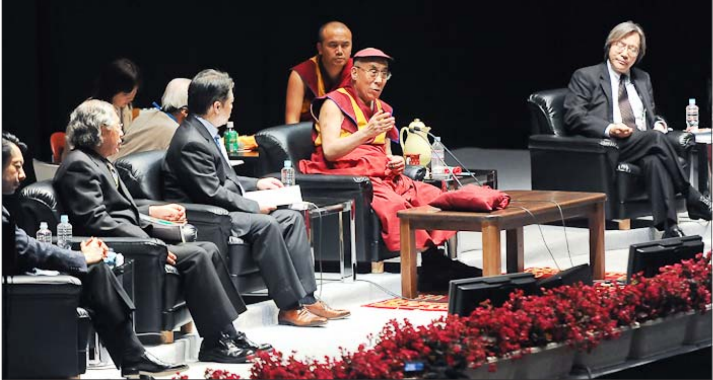
སྤྱི་ནོར་ཡགོང་ས་ཡ་སྐྱབས་མགོན་ཆེན་པོ་མཚོག་གོས་གར་ཕྱོགས་ཀྱི་ཚན་རིག་པ་ཁག་གི་ལྷན་ནང་ཚོས་དང་ཚན་རིག་པར་བཟོ་སྐྱོང་ཚོགས་འདུར་བཀའ་སློབ་སྦྱུང་བཞིན་པ།

༡། ལྷོ་ལྷོ་ ༢༠༠༧ ལྷོ་ ༡༡ ཚེས་ ༡ ཉིན་ བརྗེས་ལེན་བྱ་རྒྱུའི་གོ་སྐབས་ཐོབ་པ་འདིར་དགའ་ ནས་མི་ནི་བརྗེས་དུག་མང་གོས་བཟོ་མཁན་དེ་ཡིན། ཉི་ཤོང་རྒྱལ་ས་ཏོ་ཀོ་ཏོ་ (Tokyo) ནང་། གོ་ ཚོར་ཆེན་པོ་བྱུང་། ཞེས་དང་། ཡང་དེ་དང་འབྲེལ་ འདས་པའི་ནོར་འཁྲལ་གྱིས་ཉམས་སྲུང་གང་བྱུང་བ་ ལའི་མདུན་ལམ། ཞེས་པ་ཚན་རིག་དང་ནང་ཚོས་ བའི་ཐོག་བཀའ་སློབ་སྦྱུང་དོན། རོས་རང་ལྷོ་ལྷོ་ དེ་དག་ནས་ཐོ་སྦྱོར་ལེན་དགོས་པའི་ང་ཚོར་འགན་ དབང་བཟོ་སྐྱོང་གི་ཚོགས་འདུར་མཁས་དབང་དང་ ༢༠༠༢ ལོར་ཉི་ཤོང་དུ་ཡོང་སྐབས་གར་ཕྱོགས་པའི་ ཞིག་ཡོད། ང་ཚོས་འཕུལ་ཆས་ཡར་རྒྱས་ཀྱིས་ཐོག་