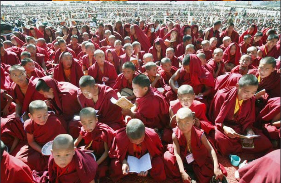
ལ་གོང་ས་ལ་སྐྱེད་པ་མཐོན་ཆེན་པོ་མཚོག་ནས་ཉེན་འབྲེལ་བསྟོན་པ་དང་སྤྱི་གསལ་གཞིགས་ཀྱི་བཀའ་དབང་སྤྱིལ་བཞིན་པ།