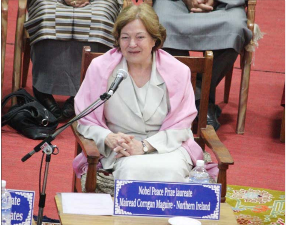
ལུས་སྐྱེམ་སྐྱེམ་མཚོགས་ཏེ་༡༩༩༦ ལོར་བྱང་ཨམ་ལེན་ཏེའི་ནང་ཚོད་རྩོད་རྒྱུ་འདུམ་འགྲིག་ཡོང་བར་འབད་བརྩོན་གནང་མཁུགས་ ཞིག་ཡིན། ཟླ་ལོ་ ༡༩༩༦ ལོར་ནོ་བེལ་ཞི་བདེའི་གཞེང་ས་རྟགས་བཞེས་སྤྱིང་མཁུགས་གསུང་བཤད་གནང་བཞིན་པ།

ནི་འཛམ་གླིང་འདི་དང་ཚོའི་བྱིས་ཚང་ཆེན་པོ་ཞིག་ དུ་བསྐྱེད་ཆུང་ལེགས་སྤྱེས་འདུལ་རྒྱུ་ལོ་སྐབས་དང་ རྒྱས་པ་ཡང་ཉ་ཅང་ཆེན་པོ་ཡིད། དུས་རབས་ ༢༡ འདི་གང་འདྲ་ཞིག་ཡོང་མི་ན་ཁྱེད་ཚོ་གཞིན་སྤྱེས་ ཚོའི་ལག་དུ་ཡོད། དག་པོའི་དབང་འཛིན་གྱི་དམ་འཁུགས་ དེ་དག་ལ་གནས་སྐབས་རྒྱལ་ཁབ་ཐོབ་པ་ལྟ་བུ་ཡོད་ རྟེན་འདྲེས་རྒྱུ་རྒྱུ་རྒྱུ་ལོ་སྐབས་ལྷན་པ་ལྷན་པ་ མེད། ཅེས་སོགས་ཀྱི་བཀའ་སློབ་གྲུབ་མཚམས་ལོ་ བེལ་ཞི་བདེའི་གཞེང་ས་རྟགས་བཞེས་སྤྱིང་མཁུགས་ པ་གསུམ་གྱིས་ནོ་བེལ་ཞི་བདེའི་གཞེང་ས་རྟགས་ བཞེས་སྤྱིང་མཁུགས་སྟེན་གཤམ་ཅན་གྱི་མི་སྣ་གྲགས་ ཅན་བརྒྱུད་ཀྱི་ཚབ་ལུས་ནས་ཡུལ་ལོ་སྐབས་མཚོགས་དང་ བོད་མི་ཚོར་རྒྱུ་རྒྱུ་རྒྱུ་གྱི་བསྐྱེད་ཀྱི་གཏམ་ཞིག་ ཡུལ་ལོ་སྐབས་མཚོགས་ལ་འབྲུལ་ལམ་ལུས་ཏེ་ལྷན་ཚོགས་ རྒྱལ་ཁབ་འདི་དང་འབྲེལ་ཡོད།