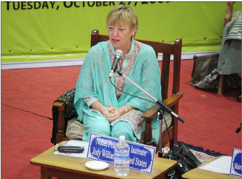
ལུ་སྐྱེ་མ་སྐྱེ་རི་མཚོག་གིས་འོག་འབར་རྗེས་འགོག་རྒྱུའི་རྒྱལ་སྤྱིའི་ཚོགས་པ་ ICBL ཞེས་པ་ཞིག་བཙུགས་ ཡོད། ལྷོ་ལྷོ་བུ་གཅིག་པའི་ཤེས་བྲུ། ལྷོ་ལྷོ་བུ་གཅིག་པའི་ཤེས་བྲུ། ལྷོ་ལྷོ་བུ་གཅིག་པའི་ཤེས་བྲུ།

དེ་ནས་སྤྱི་ནོར་ཡགོང་ས་ཡ་སྐྱབས་མགོན་ ཆེན་པོ་མཚོག་གིས་བཀའ་སློབ་ལེགས་དོན། དེ་རིང་ འདིར་ལོ་ལོ་ལོ་ལོ་བཙའི་གཟེངས་ཉུགས་བཞེས་སྐྱོང་ མཁན་རྣམ་པ་གསུམ་ས་ཐག་རིང་པོ་ནས་སྐྱེ་དལ་ འཇོམས་མེད་ཐོག་འདི་གར་ལེགས་ཏེ་ང་ཚོར་གདུང་ སེམས་མཉམ་སྦྲེ་གི་རྒྱལ་སྤྱིའི་གནང་བར་དོས་ཀྱིས་ སྤོང་ཐག་པ་ནས་ལུགས་རྗེ་ཆེ་ལྷོ་ལྷོ་བུ་གཅིག་པའི་ཤེས་བྲུ། བཀའ་སྐྱུལ། ཡང་ཡགོང་ས་མཚོག་གིས་བཀའ་སློབ་ དོན། དུས་རབས་ ༢༠ དེའི་ནང་མི་འབོར་ས་ཡ་ ༢༠༠ ཅམ་དམར་གསོད་བཏང་ཡོད་པས་དུས་རབས་ དེ་ནི་དྲག་སྤྱོད་ཀྱི་དུས་རབས་ཞིག་ཆགས་ཡོད། དེ་ ལྷོ་ལྷོ་བུ་གཅིག་པའི་ཤེས་བྲུ། ལྷོ་ལྷོ་བུ་གཅིག་པའི་ཤེས་བྲུ། གཏོང་ལུ་པ་ཡིན་ན་དེ་ནི་རྒྱལ་ཁ་ཞིག་ཏུ་དོས་ འཇོན་བྱེད་ཀྱི་ཡོད། འོན་ཀྱང་ད་ཆ་དེ་འདྲ་མ་ཡིན་ པར་ང་ཚོ་ཚང་མས་འཇམ་སྐྱོང་འདིར་རང་གི་བྱིས་ ཚང་གི་ཆ་གས་ཞིག་ཏུ་དོས་འཇོན་བྱེད་དགོས་པ་ ཞིག་རེད། དེར་བརྟེན་བྱེད་ཚོ་ན་གཞིན་རྣམས་ནས་