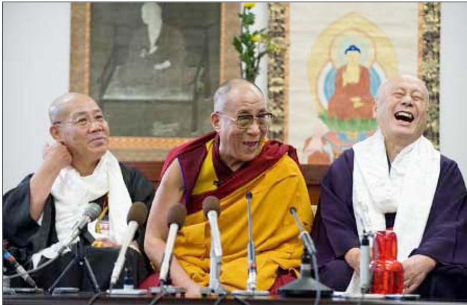
ལགོང་ས་མཚོག་ནས་ཉི་རྒྱུད་ནང་པའི་མཐུན་ཚོགས་ཀྱི་ཚོགས་གཙོ་མཚོག་དང་ཏ་གུ་ཇིའི་དགོན་གི་མཁན་པོ་ལྷན་དུ་ གསུང་མོལ་མཛད་བཞིན་པ།

ཏ་གུ་མ་སུའི་(Takamatsu) ཤི་ཀོ་ཀུའི་སྐྱེད་ཕྱུར་ ལ་ (Shikoku Island) ཆེབས་ཞལ་བསྐྱེད། སྤེལ་བུ་ ༡༠ ཚེས་ ༡ ཉིན་ལགོང་ས་ མཚོག་གོང་ཁྲིའི་ཏ་གུ་མ་སུའི་ཤི་ཀོ་ཀུའི་སྐྱེད་ཕྱུར་ནང་ ཡོད་གནའ་བོའི་ནང་པའི་དགོན་པ་ཏ་གུ་ཇིའི་ཞེས་པས་ངི་ ལྷར་གསོལ་འདེབས་ཞུས་པ་བཞིན་ཞུས་པའི་ལེགས་