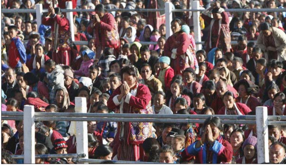
ཡཁོང་ས་མཆོག་ནས་སྐབས་དུས་ཆེན་ཉིན་ཏཱ་ལའ་བླ་མ་དགོན་པར་ཚོས་འབྲེལ་དབུ་འཇུགས་མཛད་པ།

ཡཁོང་ས་མཆོག་གིས་རྟེན་འབྲེལ་བསྟོན་པའི་གསུང་ ཚོས་ཀྱི་སྟོན་འགྲོའི་ཚུལ་དུ་ཀུན་སྦྱང་སྦྱོང་པའི་ཡན་ ལག་དུ་བྱང་ལྷུང་གི་སེམས་བསྐྱེད་སྒྲུབ་པར་ངོ་སྟོན་ མཛད་དོན། “ནས་རྒྱན་ང་ཚོའི་ཆ་སྟོལ་ལ་སངས་ རྒྱལ་ཚོས་ཚོགས་མ་ཚར་གསུམ་འདོན་རྒྱའི་ཆ་སྟོལ་ ཡོད་པ་ལྟར། ངོས་ནས་འདོན་འགོ་བཙུགས། ཁྱེད་ ཚོས་མཉམ་དུ་ལའ་ཤོག་ཨང་། སངས་རྒྱལ་ཚོས་ དང་ཚོགས་ཀྱི་མཆོག་རྣམས་ལ། །བྱང་ལྷུང་བར་