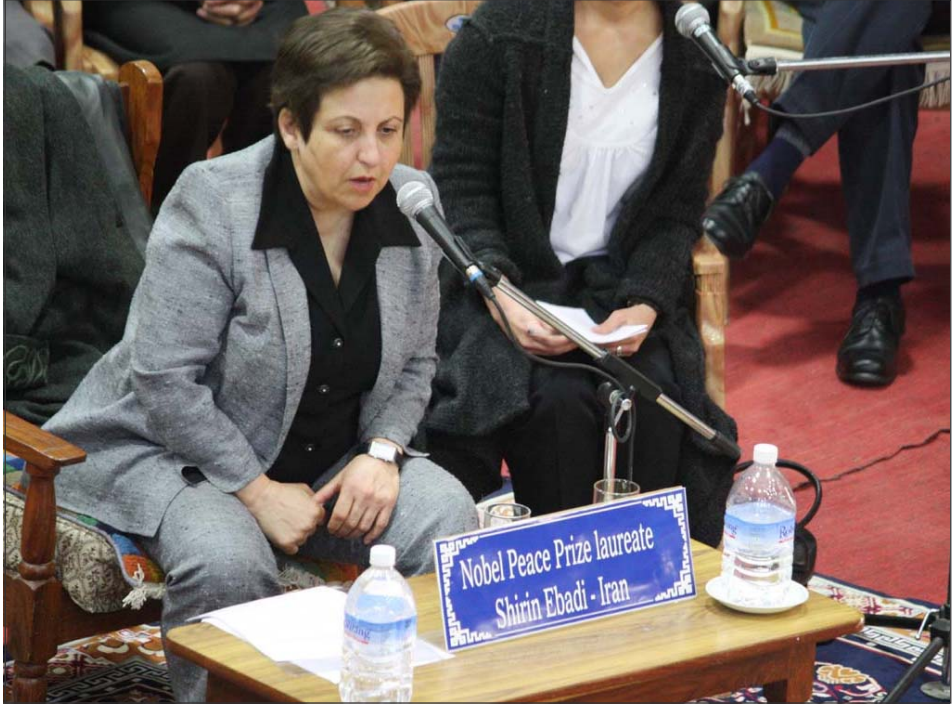
ལུ་སྐྱེ་མ་སྐྱེ་རི་མཚོག་གི་མི་རན་ནང་འགོ་བཙའི་ཐོབ་ཐང་དང་ཞི་བདེའི་ཆེད་འཐབ་རྩོད་གནང་མཁན་ཞིག་ ཡིན། ལྷོ་ལྷོ་བུ་གཅིག་པའི་ཤེས་བྲུ། ལྷོ་ལྷོ་བུ་གཅིག་པའི་ཤེས་བྲུ། ལྷོ་ལྷོ་བུ་གཅིག་པའི་ཤེས་བྲུ།

ཡོད། ད་ཐོངས་ཡགོང་ས་མཚོག་གི་ཡར་བསྐྱར་ མཇལ་ཁ་ཐོབ་པར་དགའ་ཚོར་ཆེན་པོ་བྱུང་ལ་རྗེས་ སུ་དོས་ནས་ཡགོང་ས་མཚོག་པོད་ནང་མཇལ་རྒྱུ་ རེ་བ་དང་སློན་འདུན་ལྷོ་ལྷོ་བུ་གཅིག་པའི་ཤེས་བྲུ། གསུང་བཤད་གནང་རྗེས་བྱང་ཨར་ལེན་ཏི་ (Northern Ireland) རན་ལུ་སྐྱེ་མ་སྐྱེ་རི་ མཚོག་ནས་སུང་བཤད་གནང་དོན། པོད་ཀྱི་ཡ་སྐྱབས་ མགོན་ཏུ་ལའི་རྣམ་མཚོག་དང་པོད་མི་མང་། དེ་ བཞིན་ནང་པ་ཚོས་འགོ་བཙའི་རིགས་ཀྱི་བྱིས་ཚང་ ཆེན་པོ་འདིར་ལེགས་སྐྱེས་ཏེ་ཅང་ཆེན་པོ་སྐྱུལ་ཡོད་ ལ་ད་དུང་ལུ་མཐུད་འདུལ་བཞིན་ཡོད་པ་འདི་དག་ ཞི་དུ་ལུ་དུས་ཚོད་ལ་འདིར་འཇམ་སྐྱོང་འདིར་ དགོས་ཤེས་ཅན་ཞིག་ཆགས་ཡོད། ཅེས་སོགས་ཀྱི་ གསུང་བཤད་གནང་ཡོད།