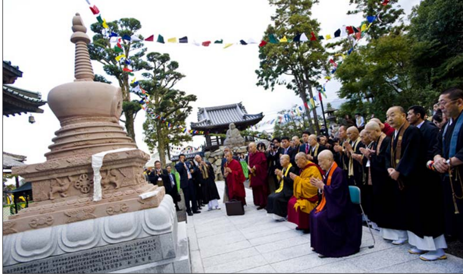
ལགོང་ས་མཚོག་ནས་ཉི་རྒྱུད་པོ་ལུ་ཁན་དགོན་དུ་རྣམ་རྒྱལ་མཚོན་རྟེན་གསར་བཞེངས་ལ་རབ་གནས་དང་དབྱེད་མཛད་བཞིན་པ།

ཡོད་པ་དང་དགོན་དེའི་མཁན་པོ་དང་མཇལ་འཕྲད་ མཛད་ཡོད། ལགོང་ས་མཚོག་དགོན་དེར་ལེགས་ སོར་མ་འཁོར་གོང་ས་ལྷུ་ལ་དེར་བེངས་འདིར་གདན་ཞུ་ གནང་མཁན་གི་སྐྱེ་བའི་པོ་མེད་པོ་ལུ་ཁན་གི་ དགོན་པར་ཁོང་ཚོས་སེམས་ཁུར་ཆེན་པོས་རྒྱ་ནག་ གཞུང་ཚུགས་ནས་བོད་ནང་བཅོན་འདུལ་བྱས་པ་དང་ ལགོང་ས་མཚོག་དང་བོད་མི་རྣམས་བཅོན་བྱེད་བྱུར་ རྣམས་ལོ་ངོ་ ༥༠ འཁོར་གི་ཡོད་པའི་དུན་རྟེན་དང་ མ་འོངས་པར་བོད་ལ་ཞི་བདེ་གང་མཚུགས་ཡོང་ རྒྱུར་དམིགས་ཏེ་རྣམ་རྒྱལ་མཚོན་རྟེན་ཞིག་གསར་ བྱེད་བཞེངས་ཡོད་པ་དེར་རབ་གནས་དང་དབྱེད་ མཛད་དེ་འདི་ལྟ་བུ་གསར་བཞེངས་གནང་བར་ཐུགས་ རྒྱུ་ཆེ་ཞེས་བཀའ་སློབ་སྤྲུལ་ཡོད། སྐབས་དེར་ཉི་ རྒྱུད་ནང་པའི་མཐུན་ཚོགས་ཀྱི་ཚོགས་གཙོ་སྐུ་ལམས་