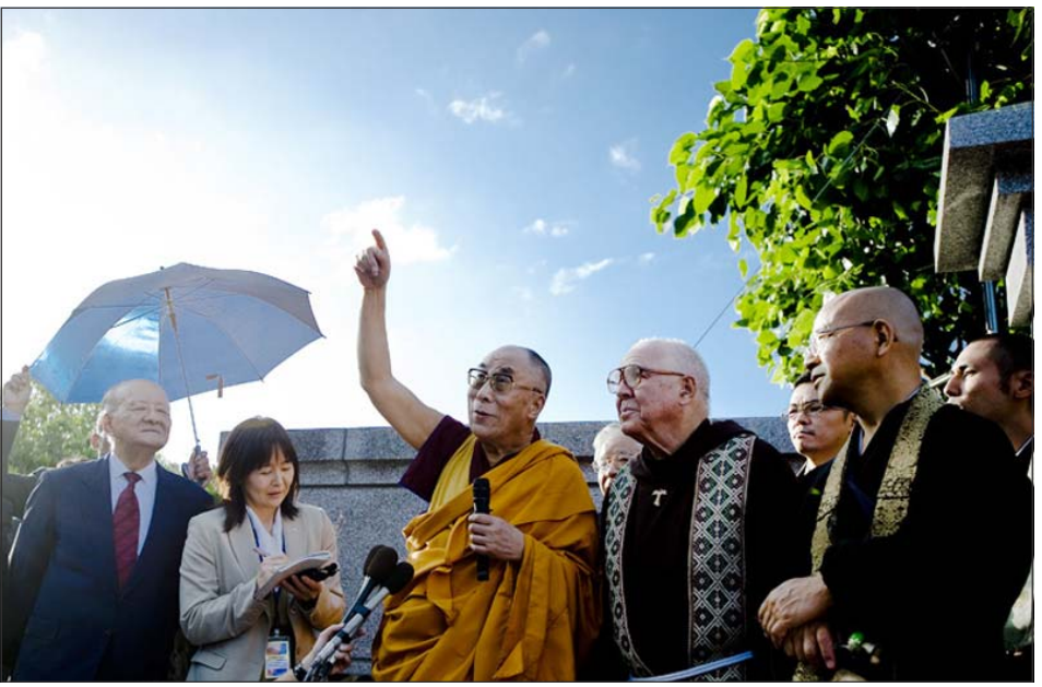
ཡགོང་ས་མཚོག་ནས་གསར་འགོད་པ་ཚོར་ངོས་ནས་བྲན་གསོལ་སྤྱི་སྤྱིང་འདིར་སློན་ལམ་རྒྱག་སྐབས་བྱེད་པ་གི་སྐད་སྐྱེན་པོ་ཐོས་བྱུང། རྒྱ་དེ་ཉེ་ཉོང་ས་རང་ལྷ་ས་དང་རྒྱ་གར་ནང་སྤོང་སྐབས་དེ་རང་ཐོས་སྤོང་བ་བྲན་བྱུང་ལེས་སོགས་ཀྱི་བཀའ་སྩལ་སྩལ་བཞིན་པ།

སེལ་ཐབས་བྱེད་དགོས། ངོས་ནས་སྤྱི་སྤྱིང་འདིར་འགྲོ་བམི་རྣམས་ལ་འཛུགས་སྐྱོང་འདིའི་ནང་ཕན་ཚུན་སློན་ལམ་རྒྱག་སྐབས་བྱེད་སྐད་སྐྱེན་པོ་ཞིག་ཐོས་གྲས་བཅི་དང་། ཅན་གྱི་ཞི་བདེ་བསྐྱུན་རྒྱུར་རྣམས་