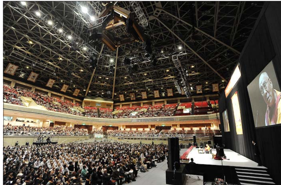
ཡགོང་ས་མཚོག་ནས་དང་ལྷན་ཚོས་ལུ་བ་རྣམས་ལ་ལམ་གཙོ་རྣམ་གསུམ་སོགས་ཚོས་འབྲེལ་སྐྱུལ་བཞིན་པ།

གཟབ་ནན་བྱེད་དགོས་སྟོར་བཀའ་སློབ་ལེབས་དོན། རང་གི་དགའ་བོའི་བྱ་སྲོད་མ་རུང་བ་དེར་གདོང་ལེན་བྱེད་དགོས་པ་ལས་དགའ་བོ་གང་ཟག་དེར་བུམས་པ་