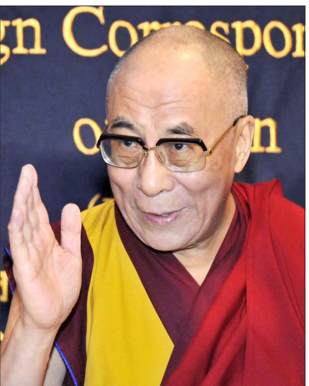
ཡཱོ་ངོང་ས་མཚོ་ག་འགས་འགོད་ལྷན་ཚོགས་ཐོག་གསར་འགོད་པའི་དྲི་བར་ བཀའ་ལན་སྐྱེད་བཞིན་པ།

ལྷོ་གྲོ་ལོ་ ༢༠༠༧ ལྷོ་ ༡༠ ཚེས་ ༡༡ རེས་གཟུང་སྟེན་པའི་ཉིན་ཡཱོ་ངོང་ས་ མཚོ་ག་གིས་ཉི་རྩོང་གི་རྒྱལ་ས་འོ་ཀྲོ་འི་ རང་གསར་འགོད་ལྷན་ཚོགས་ཐོག་བཀའ་ སློབ་ལེབས་པའི་ནང་། ཐོག་མར་མགོ་རིམ་ བཀའ་ཉིད་ཀྱི་རྒྱ་ཚུབ་ལེབས་འགྲོ་བམིའི་རིན་ ཐང་འོང་འཕེལ་དང་། ཚོས་ལུགས་མཇུག་ རྒྱུལ་ཡོད་བར་འབད་བརྩོན་མཚན་རྒྱུའི་སྤོལ་ ཆེབས་མཚན་ལཱ་དང་ལཱ་གཉིས་ཀྱི་རྒྱོད་ལ་ བཀའ་སློབ་ཟབ་རྒྱས་སྐྱེད་བའི་དང་རྒྱ་གས་ རྒྱལ་སྤོལ་ཚོགས་པ་ཁག་དང་དམིགས་ བསལ་གསར་འགོད་པ་རྣམས་རྒྱ་ནག་དང་ བོད་ནང་དུ་བྱེན་ནས་དོན་ཡོད་གནས་རྒྱུལ་ རི་ཡིན་ཞིབ་འཇུག་བྱེད་དགོས་པའི་འཁོད་ རྒྱུལ་ལུགས་ཆེ་མཚན་ཡོད། དེ་ནས་གསར་