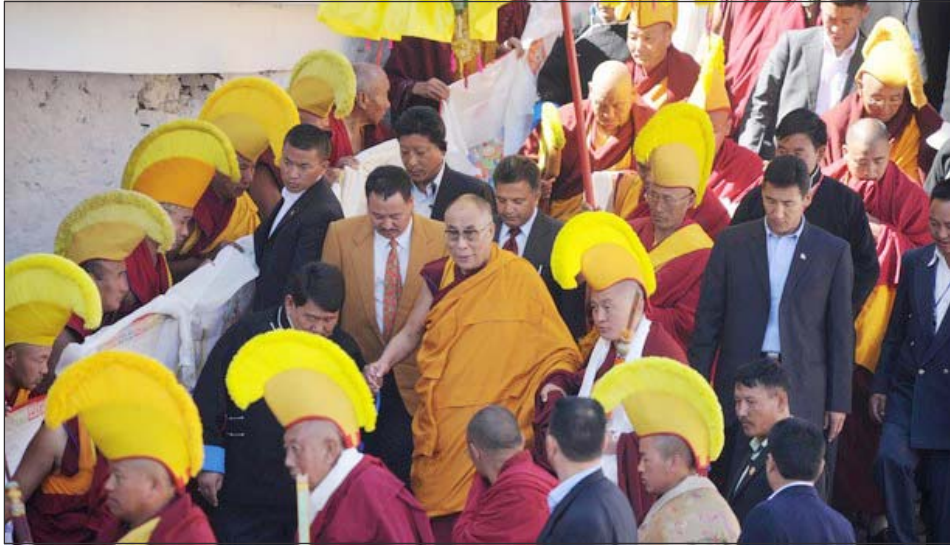
ཡགོང་ས་མཚོག་ཨ་རུ་རྒྱ་ཅལ་མངའ་སྡེའི་སྤྱི་ཁྲབ་རྒྱུ་ཚེན་དང་ཏ་དབང་དགོན་པའི་མཁའ་པོ་སོགས་ནས་ཕེབས་བསུ་ཞུ་བཞིན་པ།

ཅེ་དགོན་པའི་མཁའ་པོ་གུ་རུ་རིན་པོ་ཆེ། ས་གནས་ རྫོང་དཔོན་བཅས་གནད་ཡོད་མི་སྣ་ཁག་གི་ས་ གཙོས་ས་གནས་གཞུང་མང་རྒྱལ་སྐོར་མངའ་ སྡེའི་དམིགས་བསལ་སྐྱེ་མགོན་གྱི་མཚན་ཐོག་དུ་ ཕེབས་བསུའི་འཚོམས་འདུ་གཟུབ་རྒྱས་ཞུས་ཡོད།