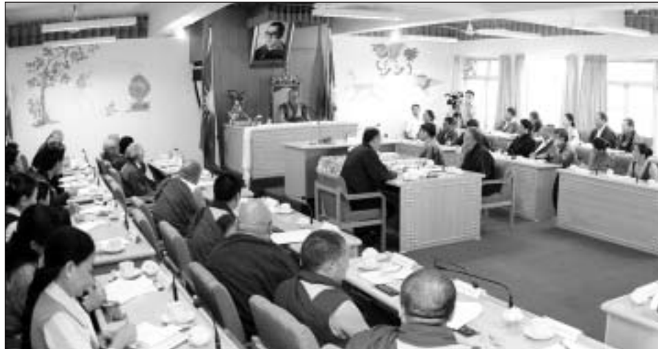
ཡལོང་ས་ཡ་སྐབས་མགོན་ཆེན་པོ་མཚོག་ནས་སྐབས་བཅུ་བཞི་པའི་གྲོས་ཚོགས་ཐངས་གཉིས་པའི་ཐོག་བཀའ་ཚོན་སྐྱོལ་བཞེད་པ།

ནོར་ཡལོང་ས་ཡ་སྐབས་མགོན་ཆེན་པོ་མཚོག་གི་སྐབས་ཆེན་གྱི་དགོངས་བཞེད་གཞིར་བཟུང་བོད་ཀྱི་མང་གཙོའི་འཕེལ་རིམ་གྱི་ནང་ཡར་རྒྱས་ཀྱི་འགྲུར་ཚོག་ཆེན་པོ་ལྷན་ནས་མི་མང་གིས་འོས་བསྐྱེ་བྱས་པའི་སྐབས་གཉིས་པའི་བཀའ་ཚོན་གྱི་པོའི་འོས་བསྐྱེ་ལེགས་པར་བཟུང་ནས་འོས་ཐོན་བྱུང་བའི་བཀའ་ཚོན་གྱི་པོ་མཚོག་གིས་གོང་ཚེས་ཉིན་གྱི་སྔོན་ལོ་སྐབས་མགོན་ཆེན་པོ་མཚོག་ལས་ལས་ཁུར་གྱི་དམ་འབྲེལ་དང་གསང་བྱའི་དམ་བཅའ་སྲུང་སྐྱོང་དོན་ལ་དོར་སྲུ་ལུགས་པ་རེད། དེ་རིང་མི་མང་ནས་འོས་བསྐྱེའི་སྐབས་གཉིས་པའི་བཀའ་ཚོན་གྱི་པོ་སྲི་འཐུས་ལྷན་ཚོགས་ཀྱི་གྲོས་ཚོགས་སུ་ཐངས་དང་པོ་ཕྱི་བས་ཡོད་པར་བརྟེན། ཚང་མས་བཀའ་ཚོན་གྱི་པོ་རིན་པོ་ཆེ་མཚོག་ལ་དགའ་བསུ་ལུ་རྒྱ་ལོན།