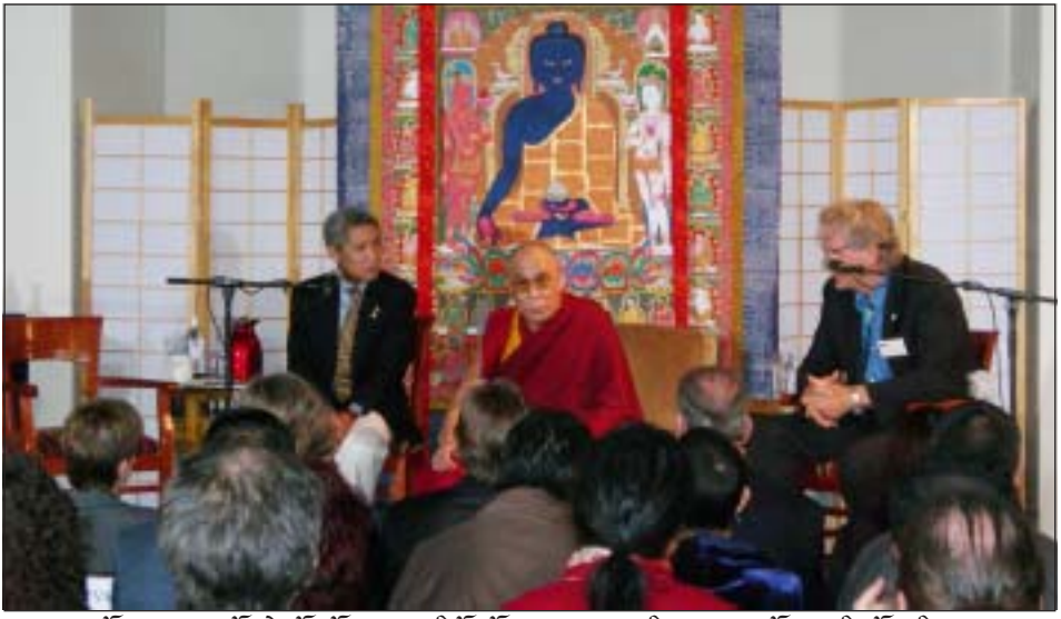
ཕྱོད་ས་ཡུལ་སླུ་ལས་མཚོན་ཆེན་པོ་མཚོ་གནས་སློབ་སྡེའི་ཚོས་ཚོགས་སུ་ཚན་རྩལ་ལས་རིགས་པར་བཀའ་སློབ་བཀའ་འདུན་སླུ་ལ་བཞེན་པ།

མངོད་སྡེའི་ཐོག་དགོན་པའི་མཇུག་རྟེན་གསུམ་ འབྲུལ་བཞེས་ཐོག་དགོན་པའི་གནས་སྐབས་ཏ་ལ་མ་