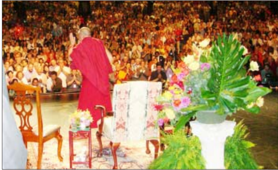
ཡུལ་ས་ཡུལ་ས་མཐོན་ཆེན་པོ་མཚོག་ནས་གེ་ལ་ལོ་ནི་ཡའི་ལས་རིགས་ཁག་གི་བཀའ་སློབ་ལུ་མཁན་མི་མང་ལ་དཀྲོས་མངའ་གནང་བཞིན་པ།

མཁའ་ལམ་བརྒྱུད་ཨ་རིའི་ལུ་ལ་སྤྱི་གས་མངའ་སྡེ་གེ་ ལ་ལོ་ནི་ཡའི་ལོ་ལོ་ལོ་ལོ་ལོ་ལོ་ལོ་ལོ་ལོ་ལོ་ལོ་ལོ་