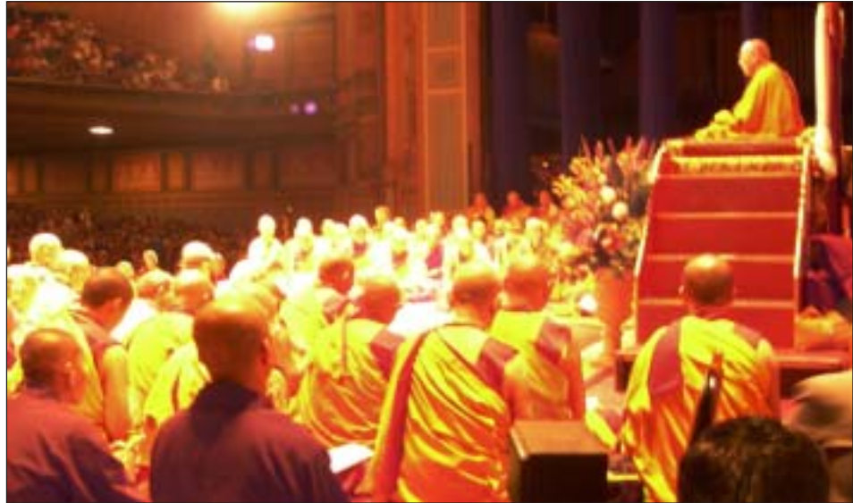
ཡུལ་ས་ཡུལ་ས་མཐོན་ཆེན་པོ་མཚོག་ནས་བྱང་ཆུབ་སེམས་འབྲེལ་གྱི་བཀའ་ཁྲིད་ཟབ་མོ་སྐུལ་བཞིན་པའི་ཚོས་རའི་དབུགས་ཀྱི་རྒྱལ་པ།

མངའ་ཁར་བཅར་ནས་ལས་དོན་སྐྱེད་ལུ་གནང་བར་ དཀྲོས་པའི་དབུགས་དབུང་གི་བཀྲིན་སྐུལ་རྗེས་སྤྱི་ལོ་