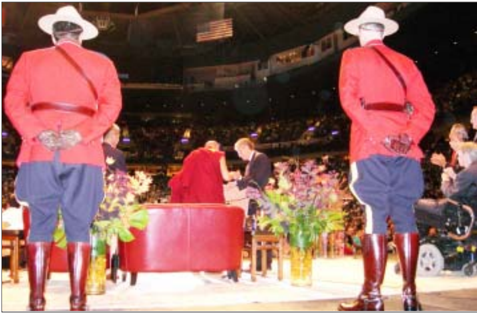
ཡགོང་ས་ཡསྐབས་མགོན་ཆེན་པོ་མཚོག་ལེ་ཧེ་ཏེ་ཡུལ་མིའི་མཚན་མཐོང་གི་གཟེངས་ཉམས་འདུལ་པའི་རྒྱལ་དོན་མཛད་སྤོའི་རྣམ་པ།

བག་ཆགས་བྱུང་ཅན་ཞིག་ལྟར་འདུག སྡེ་དེ་ཡོལ་ ལྷོ་གནས་ཁང་ཞིག་ཡིན་ཞིང་། དེའི་སློབ་སྦྱོར་པའི་ ཡགོང་ས་ཡསྐབས་མགོན་ཆེན་པོའི་མཚན་ཐོག་ རང་ཉོ་བེལ་ཞི་བདེའི་དེད་དཔོན་ཉི་མོ་མཉམ་པ་ལ་ བཅུགས་པའི་“ཞི་བདེའི་ཤེས་ཡོན་སྡེ་གནས་ཁང་”ཞེས་ དང་། སྤྱི་ཚུར་འདྲི་མི་ཁྲུང་པ་ལ། སྤྱི་ཐོབ་ཀྱི་ཀྱ། པའི་རིག་གཞུང་གི་འགན་འཛིན་དང་ལས་འཛིན་པ་ ཨི་ཡི་སྤེ་སལ། ཇོ་ཏིས་སྤྱི་ལམ། ར་མོ་སི་ཏོར་ཏེ་ ཁག་ལ་མཛུལ་ཁང་། རིག་གཞུང་ཁང་གི་ལས་གཞི་ སོགས་ཞི་བདེའི་དེད་དཔོན་བཅུ་ཕྱེད་བཀལ་བས་རྒྱབ་ དུ་འབྱེད་གནང་སྟེ་ཕྱགས་སྦྱོན་ཕྱག་ནས་བཀྱིན་སྦྱུལ། སྦྲེལ་མཚན་འགོད་གནང་ཡོད་པ་དང་། མ་གནས་ཨ་ རིག་གཞུང་ཁང་དེ་ནི་འཛམ་གླིང་གོ་གཞི་བདེ་དང་། སྦྲེལ་ས་ལ་དུག་ཕུགས་པའི་ལས་གཞི་ཞིག་ཡིན། དེ་ ཉམས་ཐག་བདེ་དོན་ཆེད་ལས་འགུལ་སྡེ་ལ་མཁུན་རྣམས་ ཇེས་ཞེ་ཧེ་ཏེ་རྒྱལ་ཡོངས་གྲོས་ཚོགས་གོང་འོག་གི་