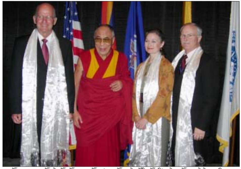
ཡལ་ལོ་ལྷོ་བས་མགོན་ཆེན་པོ་མཚོག་གིས་དབུ་བྱས་པའི་སྤྱི་བཟོ་འཛིན་བཞག་གཞིན་ནས་སྤྲོ་ལེན་ཞུ་བཞིན་པ།

གིས་དྲིས་བཟུལ་ནས་རྣམ་འགྲུར་བཞག་པ་ལས་ཀྱི་ མི་རིགས་བརྒྱ་ཆ་ ༩༩ བཀལ་བས་རང་གི་མ་