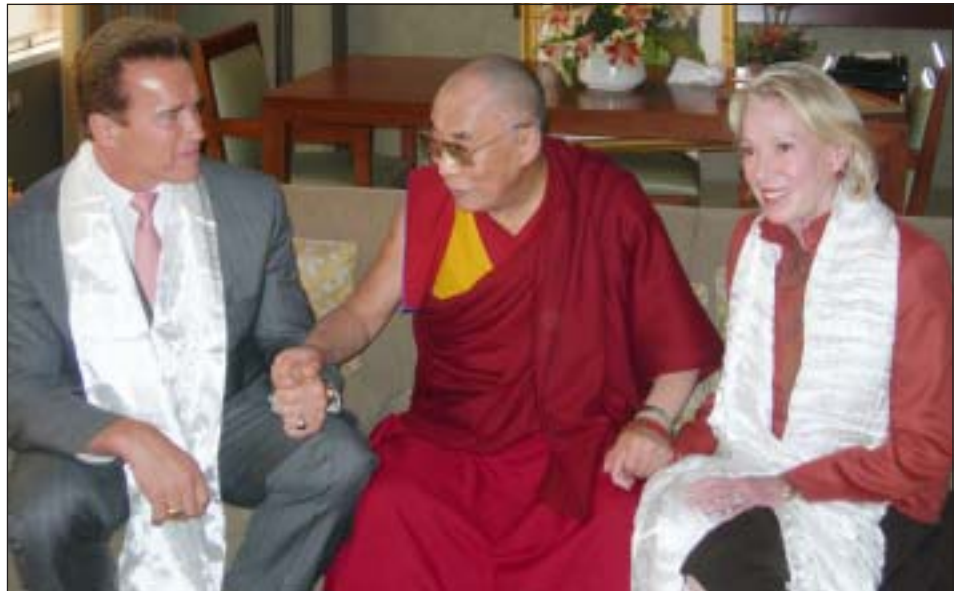
ཡོག་ས་ལྷན་པུས་མགོན་ཆེན་པོ་མཚོག་དང་མངའ་སྡེ་གི་ཡོ་རོབ་སྤྱི་དོན་རྒྱུན་རྒྱུ་རྣམས་གཉིས་མཛུགས་འཕྲིན་འཕྲིན་ལ་

ཁབ་ཚོགས་ཁང་ཆེན་མོར་གདན་དྲངས་ཏེ་རྒྱལ་སྤྱི་ དང་རྒྱལ་ནང་གི་གསར་འགྱུར་ལས་རིགས་པ་གྲངས་ ༥༠ བརྒལ་བར་མཛུགས་འདུག་གནང་སྟེ་ཆིབས་རྒྱུར་ མཛད་འཆར་དང་འབྲེལ་སྤྱི་སྟེན་གྱི་བཀའ་སློབ་རྒྱུས་ པར་བཀྲིན་སྤྱུལ། ཚོགས་ཁང་དེར་ཕིན་ལན་ཤིང་རྒྱལ་ ཡོངས་སུ་ཁྲུལ་ཁག་ནས་དོན་གཉེར་ཆེན་པོས་འདུས་ པའི་ཆབ་སྲིད་པ་དང་། ཚོན་ཅུལ་རིག་གནས་པ་སོགས་ ལས་རིགས་ཁག་གི་མི་མང་གྲངས་ ༡༥༠༠ བརྒལ་ བར་“འཛམ་གླིང་གི་བདེ་བའི་ཆེད་འགྲོ་བ་མིའི་འགན་ ཁུར་”ཞེས་པའི་བརྗོད་གཞིའི་བཀའ་སློབ་རྒྱ་ཆེ་ བཀྲིན་སྤྱུལ་བར་ཁྲུལ་དེའི་ཡོ་རྒྱུས་ནང་མཐོང་དཀོན་ པའི་མི་མང་གི་དགའ་ཚོས་ལྷན་པ་གསར་འགྱུར་ཁག་ ནས་གནས་ཚུལ་རྒྱ་ཆེ་སྤེལ་ཡོད། བཀའ་སློབ་སྐབས་ ཚོགས་ཁང་དེར་མ་འདྲུར་བའི་མི་མང་མང་པོ་ཞིག་ ཚོགས་ཁང་གཞན་གཉིས་སུ་བརྒྱན་འཕྲིན་འཕྲིན་ལམ་ ནས་གསུང་མཛུགས་ཀྱི་འདུ་འཛོལ་སྤྱི་ཚོགས་ཀྱི་བྱུང་བར་