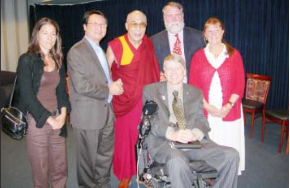
ཡགོང་ས་ཡུལ་མགོན་ཆེན་པོ་མཚོག་དང་བོད་ཁྲིར་སྤྱི་ཁྲུབ་བཞུགས་གཞིན་མཛུལ་འཕུད་སྐབས་བརྒྱན་པའི་སྤྱི་ལུ་པ།

ནས་གཞུང་འབྲེལ་གསར་འགོད་རྒྱན་ཚོགས་སུ་གདན་ དངས་ཏེ་ཡགོང་ས་ཡུལ་མགོན་ཆེན་པོ་མཚོག་ དང་སྤྱི་ཁྲུབ་རྒྱན་རྒྱས་ནས་རྒྱལ་སྤྱི་དང་རྒྱལ་ནང་གི་