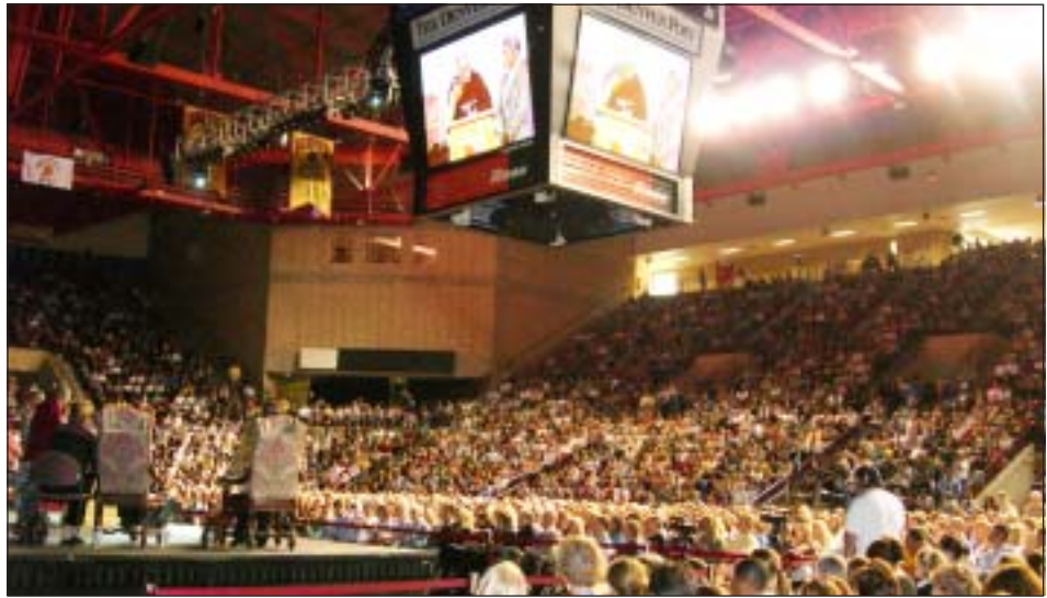
ཡགོང་ས་ཡུལ་མགོན་ཆེན་པོ་མཚོ་གནས་མངའ་ཁུལ་ཚོན་ཚུལ་ལས་རིགས་པའི་ཤེས་ལྡན་མི་སྣ་ཁྲི་ཚོ་བཀལ་བར་བཀའ་སློབ་སྤྲོད་བཞེས་པ།

འབྲུལ་བཞེས་ཐོག་བརྟན་དོན་གྱི་བདེ་སྤྱད་གནས་ཚུལ་ གྱི་ཤེས་ལྡན་པ་གྲངས་ ༡༤༤༠༠ བཀལ་བར་“ཚོན་ གསལ་བཞེས་དང་། ཚོས་ཚོགས་ནས་གསར་གཏོད་ རིག་དང་བྱམས་བརྩེས་མི་ཚོར་སྟིང་པོ་བརྟུན་པ་”ཞེས་