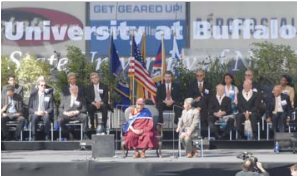
ཡགོང་ས་ཡུལ་ལས་མགོན་ཆེན་པོ་མཚོག་ལ་རྒྱ་ལྷོ་ལོ་གུའུ་ག་ལག་སློབ་ཤུ་ཆེན་མོའི་དགེ་སློབ་ཡིངས་ལ་གཞུང་སློབ་ཤུ་ལ་འགྲུབ་འདེད་ལྷོ་ལྷོ་ལ་བཞེས་པ།