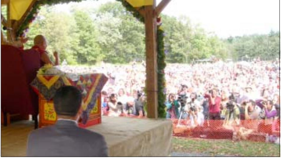
ཕྱོད་ས་ཡུལ་སླུ་ལས་མཚོན་ཆེན་པོ་མཚོ་གནས་ཕྱོད་ཁྲིམ་སྲུ་སི་རོ་ཀ་གི་ལས་རིགས་ཁག་གི་མི་མང་ལ་བཀའ་སློབ་བཀའ་འདུན་སླུ་ལ་བཞེན་པ།

བཏབ་པ་བཞེན་ས་གནས་སུ་ཆེད་སྲུ་རྒྱུར་གནང་སྟེ་ ལས་རིགས་ཁག་གི་མི་མང་གྲངས་ ༡༥༠༠ བཀའ་ བར་“ཉིན་རེ་མི་ཆེ་བཟང་མཐའ་འཁྲུལ་བྱུང་ཆེ་ འང་མ་སྤོང་ཞི་བདེར་ལྷན་པ་ཡོད”ཅེས་པའི་བརྗོད་ བཞེད་པའི་བཀའ་སློབ་རྒྱ་ཆེ་སླུ་ལ་བར་མི་སེམས་ལ་གཡོ་ འབྲུལ་གྱི་ཁ་རྒྱབས་བྱུགས་ཆེ་ཞིག་འབྲུར་འབྲུག་དེ་ གས་ཀྱིས་སྲུ་མ་ཅེན་སྤོང་དགོན་པ་ནས་རྩི་རྩུར་གསོལ་ བ་བཏབ་པ་བཞེན་དགོན་པར་ཆེད་སྲུ་རྒྱུར་གནང་སྟེ་ གཙུག་ལག་ཁང་ལ་བྲུགས་སློབ་སླུ་གས་དང་ བཞུགས་ཁྲིར་ཡུལ་སླུ་ལ་ཟུང་འཕྲོད་འབྲུལ་ཤེབས་སྟེན་