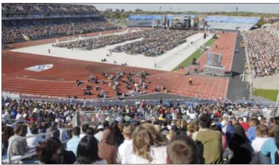
ཡགོང་ས་ཡུལ་ལས་མགོན་ཆེན་པོ་མཚོག་ལ་རྒྱ་ལྷོ་ལོ་གུའུ་ག་ལག་སློབ་ཤུ་ཆེན་མོའི་དགེ་སློབ་ཡིངས་ལ་གཞུང་སློབ་ཤུ་ལ་འགྲུབ་འདེད་ལྷོ་ལྷོ་ལ་བཞེས་པ།

ལྷོ་ཁྲི་བཟུ་གནང་སྟེ་སློབ་ཤུའི་གཙོ་འཛིན་མཚོག་ལ་ ལས་ཡགོང་ས་ཡུལ་ལས་མགོན་ཆེན་པོ་མཚོག་གི་ འཛིན་ཁྲིམས་སློབ་ཤུ་སློབ་ཤུ་ཆེན་མེད་འཛིན་ལ་ རྒྱ་ལྷོ་ལོ་གུའུ་ག་ལག་སློབ་ཤུ་ཆེན་མོས་ཁྲིམས་ ལུགས་སློབ་ཤུའི་གཙོ་འཛིན་དང་། ལྷོ་ལྷོ་ལོ་གུའུ་ ལག་སློབ་ཤུའི་རིགས་བདག་ཅུ་གཉིས་ནས་གུའུ་ ལག་སློབ་ཤུའི་མཚོག་གནས་ཆེ་གོས་ཀྱི་གོ་མིང་ ཁྲིམས་ལུགས་སློབ་དཔོན་ཆེན་པོའི་ཕྱག་འཁུར་ཕྱག་ ཏུ་ཕྱུལ་བར་ཚོགས་རྒྱ་ཡིངས་ནས་ཐུག་འཕྲིད་ཕྱག་ བཞེས་པ་ལྟར་བསྐྱབས་ཏེ་དགའ་འཕོང་གྱིས་སྐྱེས་ ཚེད་ཐང་ཡིངས་སུ་བྱུང་བ་དང་། ཡགོང་ས་མཚོག་ ལས་སློབ་ཤུའི་གཙོ་འཛིན་འགྲེམ་གཞིན་དང་དགེ་ ལས་སློབ་ཤུག་བཅས་མི་གྲངས་ ༩༠༠༠༠ བརྒལ་ བར་གུས་ལན་འཚམས་འདྲི་དང་འབྲེལ་བའི་ཤེས་ཡོན་ སློབ་གསོར་བརྟེན་ནས་ལྷོ་ལྷོ་ལོ་གུའུ་ག་ལག་སློབ་ ཤུ་ཆེན་མོས་ཞུས་པའི་བརྗོད་གཞིའི་བཀའ་སློབ་ཀྱི་ཚུལ་ ཞིང་། བཀའ་སློབ་དེ་ནི་སློབ་ཤུའི་ལོ་རྒྱུས་ཐོག་མི་སེམས་ འགྲུལ་གོས་དང་དགེ་སློབ་འདུ་འཛོམས་ཆེ་གོས་སུ་གྱུར་ ཡོང་བ་དང་། སློབ་ཤུས་ད་ཕན་ལོ་རྒྱུས་ཐོག་སློབ་ ཤུའི་ཕྱི་ཕྱོད་སློབ་སློབ་སློབ་མཚམས་འཛོག་གིས་བཀའ་ སློབ་ཞུས་པ་ཐོངས་དང་པོར་གྱུར་ཡོང་བར་བརྟེན་དེའི་ རོ་བོ་ནས་ཆེས་རྒྱ་ལྷོ་ལོ་གུའུ་ག་ལག་སློབ་ཤུ་ཆེན་ མཚོག་ཡོད་པ་གསུང་འགྲུར་ཁག་གིས་རོ་མཚར་ གནས་ཚུལ་དུ་རྒྱུ་བསྐྱབས་ཀྱི་ཆེ་ཞུས་འདུག། ལྷོ་ཁྲི་བཟུ་ ༩༠ ཉིན་གྱི་རྒྱ་ལྷོ་ལོ་གུའུ་ག་ལག་ འཛིན་སྐྱོད་གཞིན་དང་། ལྷོ་ལྷོ་ལོ་གུའུ་ག་ལག་ ལག་སློབ་ཤུ་ལུགས་པའི་དགེ་ལྷན་ཆེན་མོ་ཁག་ཅིག་ མངལ་ཁར་བཅར་བར་གསུང་མོལ་གནང་རྗེས་གུའུ་ ལག་སློབ་ཤུའི་ཁྲིམས་ལུགས་རིག་པའི་ཚན་ཁག་ནས་ རི་ལྷོ་ལྷོ་ལོ་གུའུ་ག་ལག་སློབ་ཤུའི་མཚོག་ལྟར་ གདན་དྲངས་ཏེ་སློབ་ཤུའི་ཁྲིམས་ལུགས་དགེ་ལྷན་ མོགས་རྒྱ་བསྐྱོགས་ཁྲིམས་ལུགས་རིག་པ་མཁས་