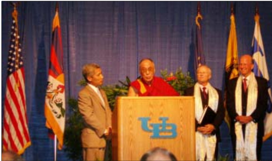
ཡགོང་ས་ཡུལ་ལས་མགོན་ཆེན་པོ་མཚོག་ལ་རྒྱ་ལྷོ་ལོ་གུའུ་ག་ལག་སློབ་ཤུ་ཆེན་མོས་ཁྲིམས་ལུགས་སློབ་དཔོན་གྱི་གོ་མིང་འདུལ་བཞེས་གནང་བཞིན་པ།