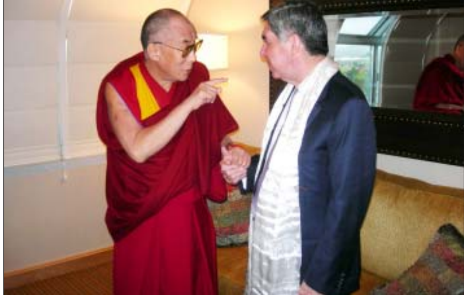
ཡུལ་ས་ལ་སྐྱབས་མགོན་ཆེན་པོ་མཚོ་གདངས་ཀོ་སི་ཏ་འི་ཀའི་སྲིད་འཛིན་ཚུ་མ་གཉིས་མཇལ་འཕྲད་གསུང་མོལ་གནང་བཞིན་པ།

ཞལ་མཇལ་དང་བུམས་བརྟེན་རིན་ཐང་སྐོར་བཀའ་ སློབ་ཚུ་ཆེ་བཀྱིན་སྐྱེལ་བར་ན་གཞིན་ནམས་ལ་རང་ ཉིད་ཀྱི་ལང་ཚོ་དར་རྒྱས་དང་མི་ཚོའི་སྤྱད་སྤོངས་ ཐད་ཡང་དག་པའི་སློབ་སློབ་ཚུ་ཆེ་སྤེལ་བ་ལྟར་བྱུང་བ་ མཁྱིན་དབྱངས་གཅིག་གིས་སློབ་དཔལ་ལྡན་འགྲུལ་ཁག་ གིས་དྲིལ་བསྐྱེད་སྤྱད་སྤོངས་ཆེ་ཞུས་འདུག ཉིན་གྱི་ ཐོངས་དེའི་མགོན་པོ་དག་གི་མོང་ལོང་ལོ་ལོ་ལོ་ བའི་དེད་དཔོན་ཚུ་མས་དང་། ཐོངས་དེའི་ལས་འཆར་ ཀྱི་ཚུ་སྐོར་བ་འགྲོལ་ལུ་ལུ་ལུ་ལུ་ལུ་ ༡༥ ལྟན་ཉིན་ གྱི་གསོལ་སྟོན་ཚུ་ཆེ་བཟམས་ཏེ་སྤེལ་ལེན་གནང་བར་ ཆིབས་སྐྱུར་གྱིས་གསུང་མོལ་བྱས་པར་བཀྱིན་སྐྱེལ། ཕྱི་དུང་ཡོལ་དཔེ་ལྟར་ཇི་ལྟར་ BBC བརྒྱན་འཕྲིན་ལས་ཁང་ གི་ཚོམ་སྒྲིག་པ་དང་སྐྱེན་སྐྱོན་པ་གྲགས་ཅན་མཁྱེན་ ལུ་མ་ Zanaib Badawi ལས་“དཀའ་གནད་ཆེ་ བའི་སློབ་མོལ་”ཞེས་པའི་བརྒྱན་འཕྲིན་ལས་རིམ་གྱི་ བཀའ་ཤིར་བཀའ་ལན་བྱས་པར་སྐྱེལ་ཏེ་བརྒྱན་འཕྲིན་ ལས་ཁང་ནས་འཇམ་སྐྱོང་འཕྲིན་ལམ་ཐོག་ཐོངས་ གསུམ་ཅོལ་དྲིལ་བསྐྱེད་སྤྱད་སྤོངས། དེ་རྗེས་མི་མི་རྣམས་ ནས་ཤོ་སྤྲིག་གནང་བ་བཞིན་ན་གཞིན་གྲངས་ ༡༠༠༠ བརྒྱལ་བར་ལོ་ལོ་ལོ་ལོ་ལོ་ལོ་ལོ་ལོ་ལོ་ལོ་ལོ་ གི་བཀའ་སློབ་སྐྱེལ་མ་བཅུ་རེའི་མངའ་སྟོན་གནད་ དངས་ཏེ་བཀའ་སློབ་སྟོན་བརྒྱུས་བཀྱིན་སྐྱེལ།