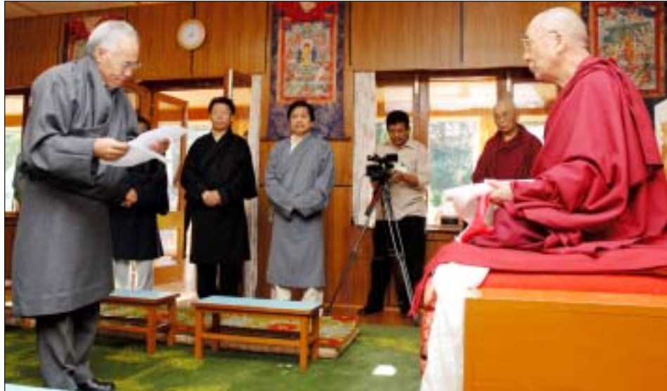
འོས་ཐོན་བཀའ་རྒྱོན་རྣམས་ནས་ཡགོང་ས་ཡུལ་མགོན་ཆེན་པོ་མཚོག་ལ་ལས་ཁུངས་ཀྱི་དམ་བཅའ་འབུལ་བཞེས་གནང་བ།