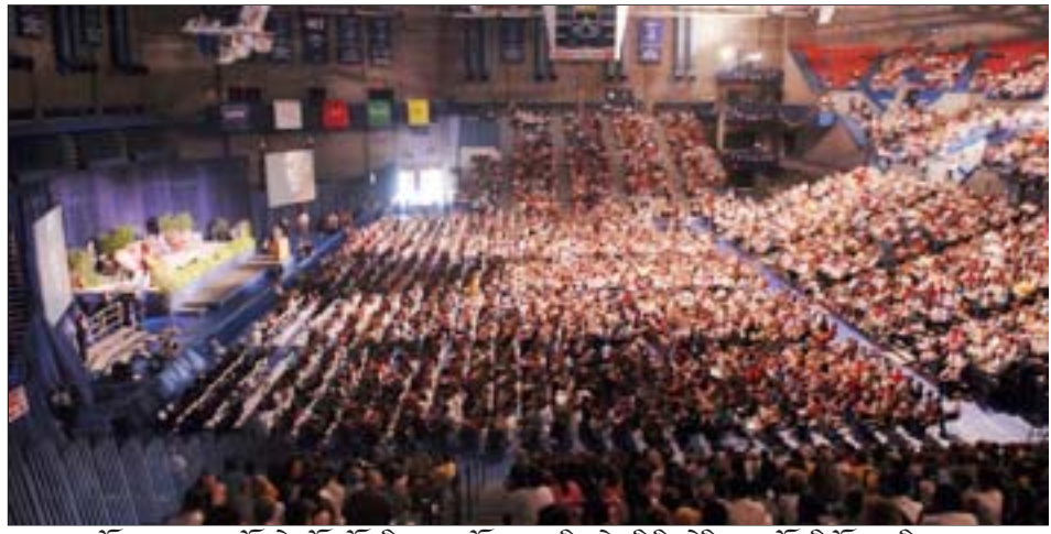
ཡལ་ལོ་ལྷོ་བས་མགོན་ཆེན་པོ་མཚོག་གིས་དབུ་བྱས་པའི་སྤྱི་བཟོ་འཛིན་བཞག་གཞིན་ནས་སྤྲོ་ལེན་ཞུ་བཞིན་པ།

ཆེབས་སྐྱུར་གནང་སྟེ་མའོ་ཙེ་ཏུར་སོགས་གསར་བཞེ་ པ་ཀན་གསར་དང་འབྲེལ་མོལ་བྱུང་བའི་གནས་ཚུལ། ལྷོ་ལོ་ ༡༩༧༩ ལོར་བོད་ས་ཡོངས་ཚོགས་ཀྱི་གཞུང་ རས་དྲུག་པོའི་དབང་སྐྱུར་བྱས་ཤིང་གི་གནས་ཚུལ། ལྷོ་ལོ་ ༡༩༧༡ ལོ་ནས་ད་ལྟའི་བར་ཡལ་ལོ་ལྷོ་བས་མཚོག་ རས་པོད་ཀྱི་བར་གཉིས་སྤོང་འགྲིགས་ཆགས་ཡོང་ ཐབས་སུ་དགོངས་བཞེས་དང་འབད་ཐབས་གནང་བའི་ སྐོར། གཉིས་སྤོང་དབུ་མའི་ཐབས་ལམ་ལ་བརྟེན་ རས་འབྱུང་འགྱུར་གཉིས་ཡན་མཉམ་གནས་ཀྱི་མངོན་