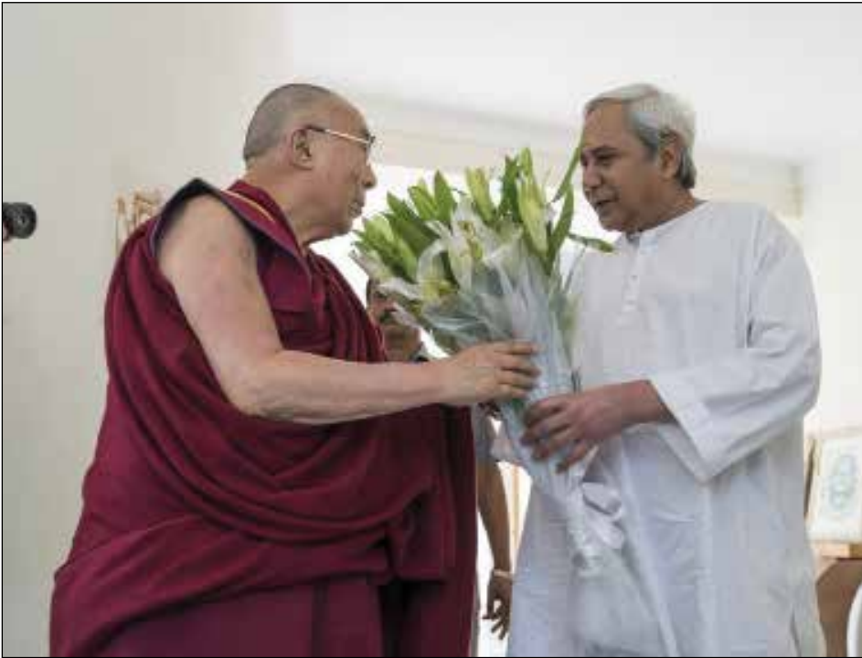
གནམ་ཐང་གི་སྤྱི་ལོ་དུ་བོད་མི་གཙོ་བོར་གྱུར་བའི་ འདུག དེ་རྗེས་མངའ་སྡེའི་སྤྱི་ཁྲབ་སྡེ་རྒྱུ་ཞབས་ དང་ཐུན་མེད་སྤྱི་མཚོག་དམན་ཀྱན་གྱིས་དགའ་དད་སྤོ་ བ་མིན་པ་ཞེས་མཚོག་གི་བཞུགས་གནས་སུ་ཞབས་ གསུམ་གྱི་སྒོ་ནས་མེད་ས་བསྐྱེད་ལེན་གཟབ་རྒྱས་ཞུས་ སོར་འཁོད་མཚོགས་མངའ་སྡེའི་སྤྱི་ཁྲབ་སྡེ་རྒྱ་

མཚོག་གིས་ཡུལ་ས་མཚོག་ལ་འཚམས་འདུག་ཟེས་ སྤྱི་ཁྲབ་པ་མ་ཟད། དབུ་བྱིད་རྣམ་གཉིས་འཁྲུག་ཙམ་ རིང་མངའ་མོལ་མངོད།