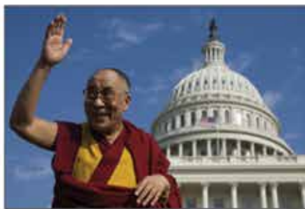
ཨ་རིའི་གྲོས་ཚོགས་གོང་འོག་ནང་ལོ་གོང་ས་ མཚོག་དང་པོད་དོན་རྒྱབ་སྐྱོར་ བྱགས་ཆེ་ལུས་པ།