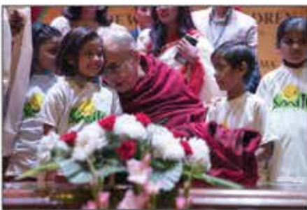
ལོ་གོང་ས་མཚོག་ནས་དེ་མིའི་ཉེན་གཞི་བྱས་ པའི་བྱིས་པ་སྲུང་སྐྱོབ་ཚོགས་པར་ཉིན་སྟོར་ འབྲུམ་ ༡༣༥ གསོལ་སྐུལ་མངོན་པ།