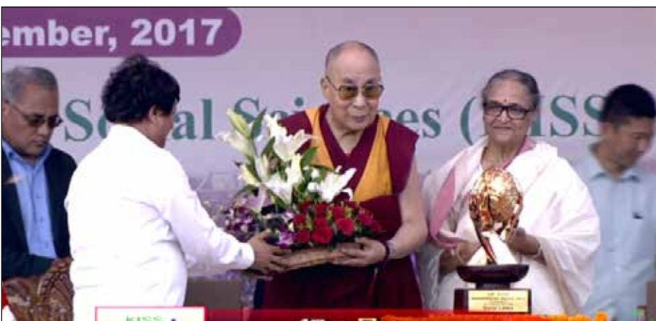
༡༡ | ཀྱི་གར་ལོ་སྤྱི་ས་མངའ་སྡེའི་ནང་རྟེན་གཞི་ 10th KISS Humanitarian Award བོད་མིའི་ལྷོ་ བྱས་པའི་ཀ་ལི་སྤྱི་མཚོགས་ཚན་རིག་བསྐྱེད་གནས་ཁང་ བ་མེད་པའི་དབུ་བྱིད་སྤྱི་ལོ་ཡུལ་ས་ཡ་སྐབས་མཁོན་ སྤོ་མཚོག་ལ་འབུལ་ལམ་ཞུས་འདུག རིང་མོ་ལྷོ་ ༢༠༡༧ ལྷོ་ ༡༡ ཚེས་ ༡༡ ཉིན་ཀ་ལི་སྤྱི་