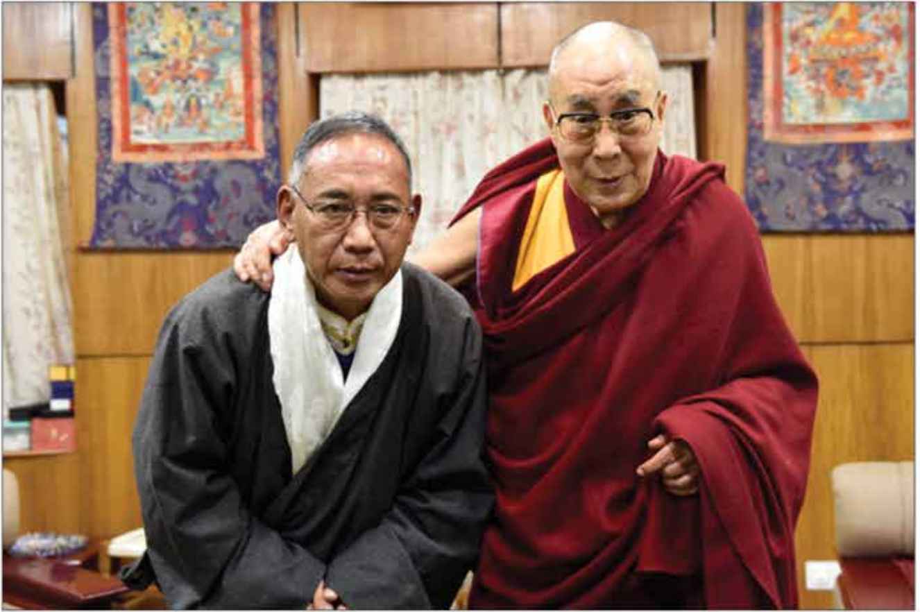
དངོས་གྲུབ་ཚེ་རིང་མཚོག་ཨ་རིའི་སྐྱེ་ཚབ་དོན་གཙོད་གསར་པར་བསྐོ་བཞག་གནང་རྗེས་ལོ་གོང་ས་མཚོག་ལ་ ཐོན་མངལ་ལྷུ་སྐབས།