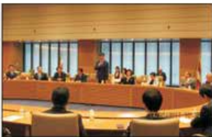
སྲིད་སྐྱོང་མཚོག་གིས་ཉེ་ཤོང་གྲོས་ཚོགས་ནང་གསུང་བཤད་གནང་བཞིན་པ།