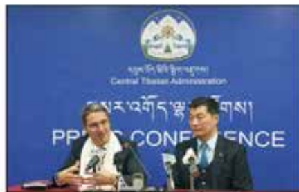
སྲིད་སྐྱོང་མཚོག་དང་ལྷོ་ཉེ་རོལ་སྲིད་འཛིན་ནས་གཉིས་ནས་གསུང་བཤད་གནང་བཞིན་པ།