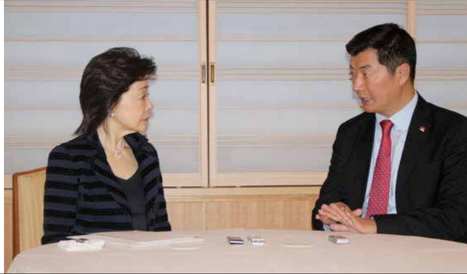
འབོད་སྤོང་ཞབས་ཤིན་ཏོ་གི་ གཞན་ཡང་བོད་ནང་གི་གནས་སྤོང་དང་ འབྲེལ་སྤོང་སྤོང་མཚོག་གིས་ལོ་རྒྱུས་ཀྱི་སྤོང་གསུང་བོད་

ཡོད་པ་ཞིག་ཆགས་ཡོད་པར་བརྟེན། བོད་ནང་དཀའ་ སྤྱུག་སྤོང་བཞིན་པའི་བོད་མི་ཚོར་རེ་བ་དང་སྤོང་སྤོང་ སྤོང་རྒྱུ་ལྟའི་བར་ལན་ཞིག་སྤོང་དེས་ཡིན་ཞེས་དང་། ལྷག་ པར་སྤོང་སྤོང་མཚོག་གིས་ཉེ་ལམ་ཉེ་དོར་གི་སྤོང་སྤོང་ སྤོང་ཞབས་ཤིན་ཏོ་ཨ་ལྷོ་ Shinzo Abe མཚོག་གིས་ ཨ་རིའི་སྤོང་འཛིན་སྤོང་ཞབས་ཤིན་ཏོ་ཉེ་ལམ་ Donald Trump མཚོག་དང་མངའ་འཕྲད་བྱུང་བར་འཚམས་ འདྲི་གནང་བ་དང་ཆབས་ཅིག་སྤོང་སྤོང་ཞིན་ཏོ་ཨ་ལྷོ་ མཚོག་གིས་ཉེ་དོར་གཞུང་ནས་ཨ་རི་དང་མཉམ་འབྲེལ་ གྲིས་རྒྱལ་སྤོང་སྤོང་ཚོགས་ཀྱི་གནད་དོན་ལ་གཟེགས་ དོགས་གནང་རྒྱུ་ཡིན་གསུངས་པ་བཞིན་བོད་རིགས་ ཡོངས་ལ་མིང་དོན་མཚུངས་པའི་རང་སྤོང་སྤོང་ཞབས་ སྤོང་དབྱེ་མའི་ལམ་གི་སྤོང་བྱུས་ལ་རྒྱལ་སྤོང་ཡོང་བའི་