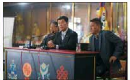
སྲིད་སྐྱོང་མཚོག་གིས་བྱེད་མེད་ལྷན་ཚོགས་ཐོག་གསུང་བཤད་གནང་བཞིན་པ།